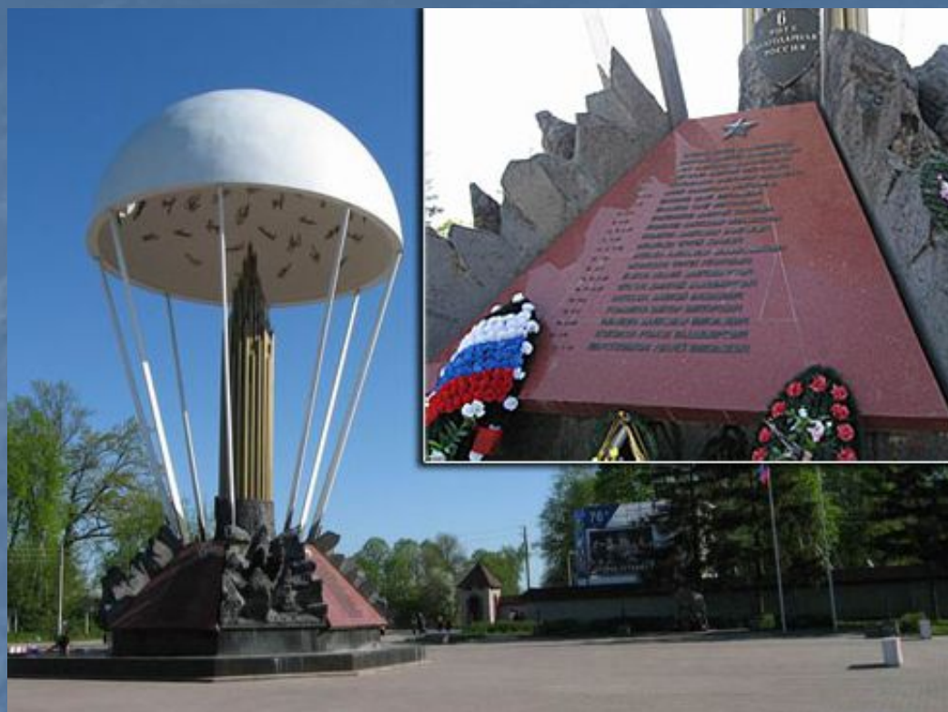
г.Псков, памятник 6-й роте.