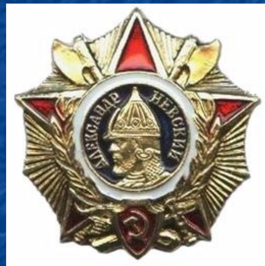
Значок А. Невский

Медаль А. Невский За труды ради Отечества