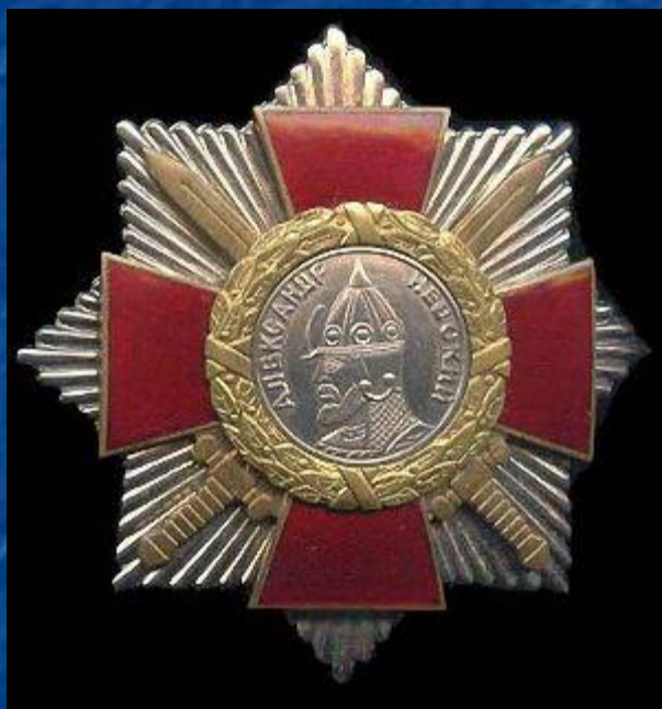
А. Невский 3 степени

Медаль А. Невский За труды ради Отечества