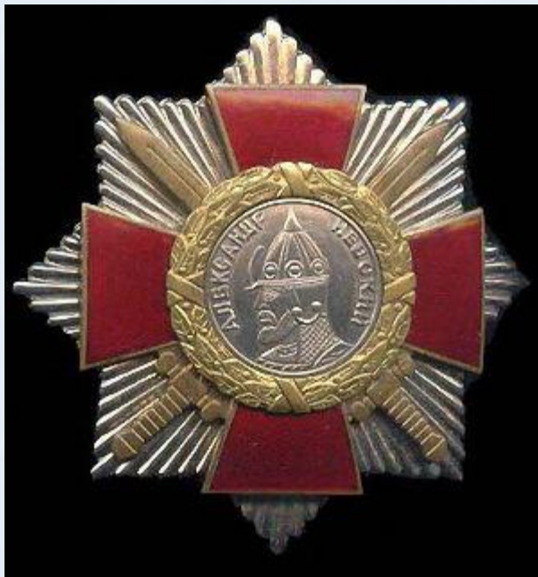
А. Невский 3 степени

Медаль А. Невский За труды ради Отечества