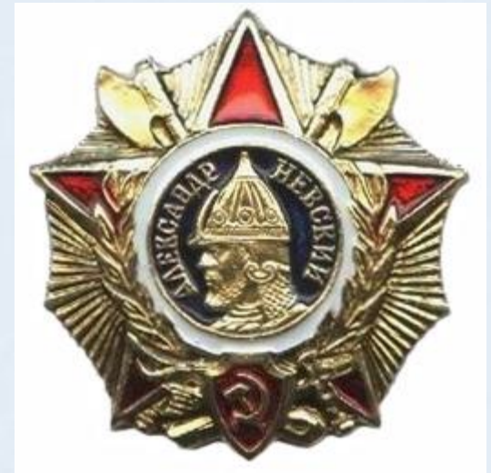
Значок А. Невский

Медаль А. Невский За труды ради Отечества