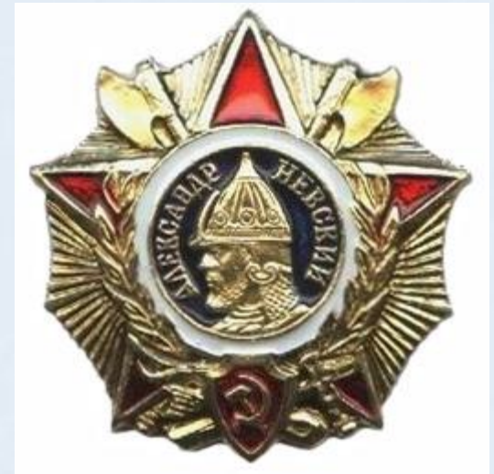
Значок А. Невский

Медаль А. Невский За труды ради Отечества