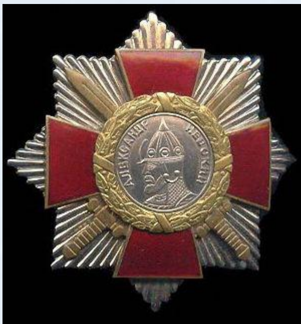
А. Невский 3 степени

Медаль А. Невский За труды ради Отечества