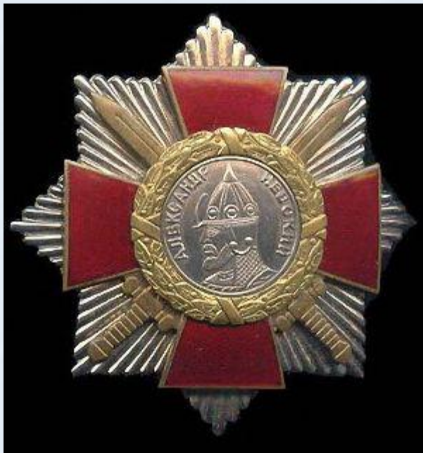
А. Невский 3 степени

Медаль А. Невский За труды ради Отечества