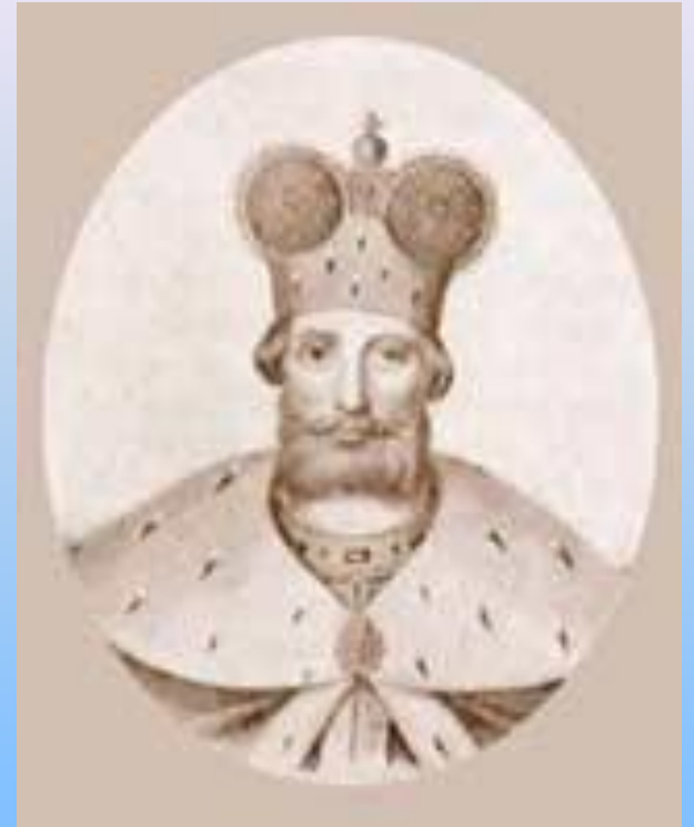
Ярослав II Всеволодович, отец Александра

родился в ноябре 1220 года (по другой версии 30 мая 1220 года) в семье князя Ярослава II Всеволодовича и рязанской княгини Феодосии Игоревны.