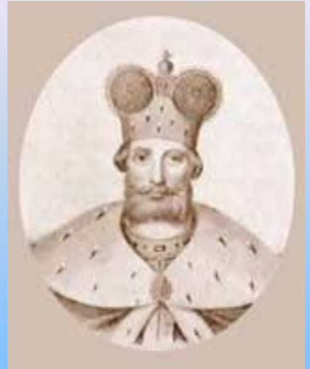
Ярослав II Всеволодович, отец Александра

родился в ноябре 1220 года (по другой версии 30 мая 1220 года) в семье князя Ярослава II Всеволодовича и рязанской княгини Феодосии Игоревны.