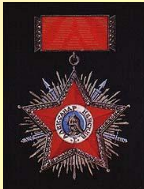
Вариант 1942 года