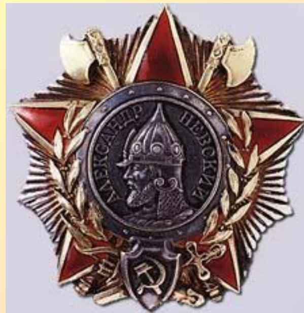
Вариант 1943 года