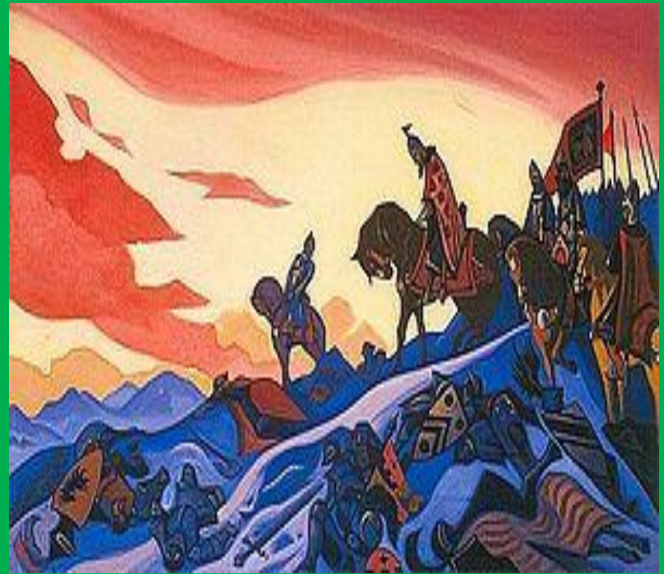
«Александр Невский». Н.К. Рерих. 1942