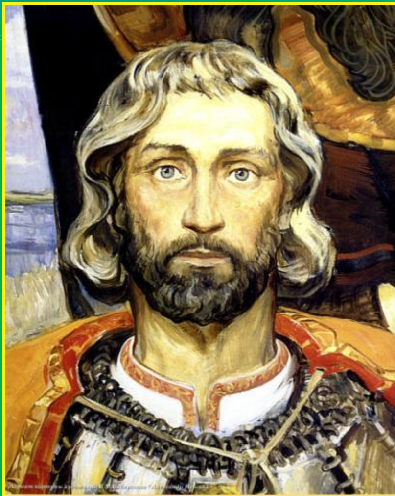
АЛЕКСАНДР НЕВСКИЙ (1220-1263)