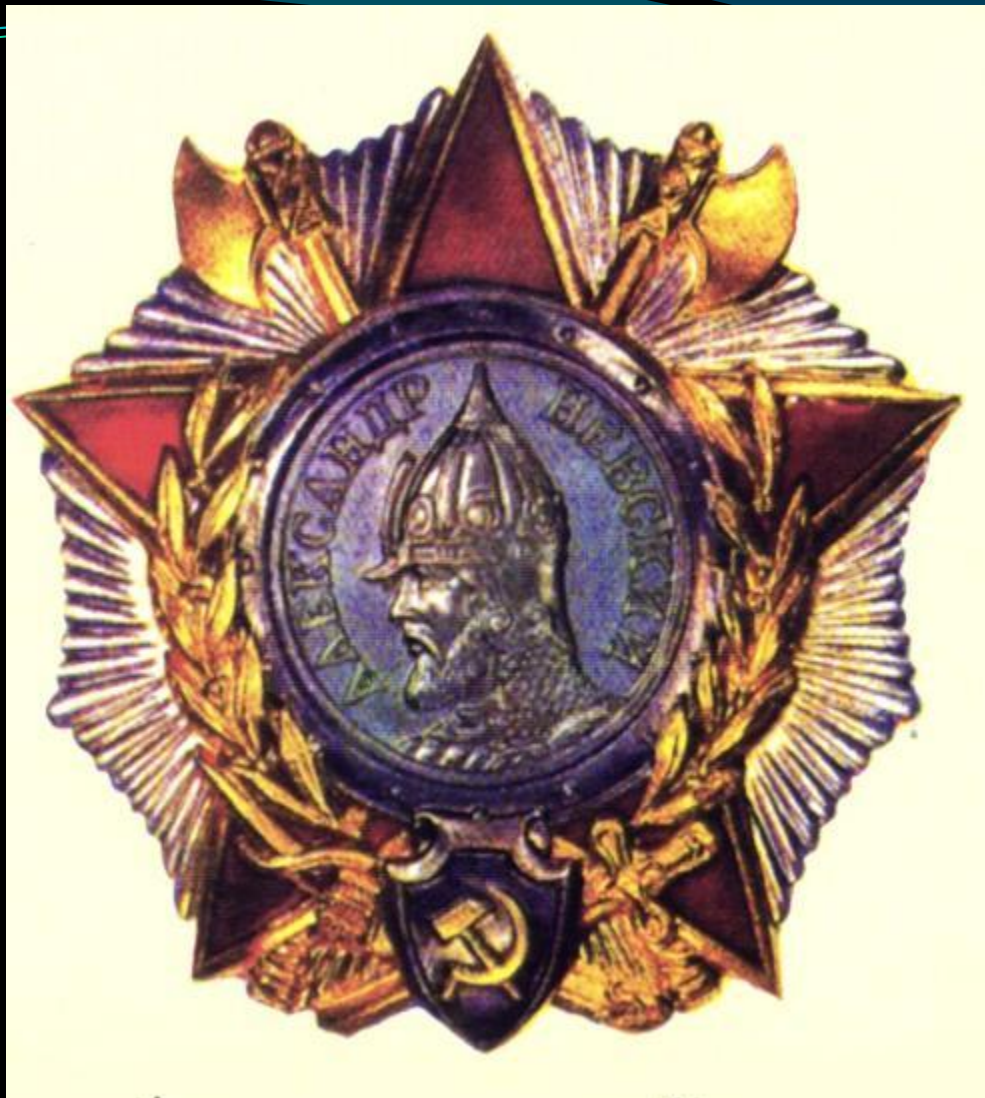
ОРДЕН АЛЕКСАНДРА НЕВСКОГО