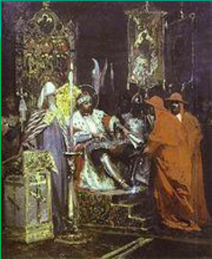
«Князь Александр Невский принимает папских легатов». Генрих Семирадский.1876.