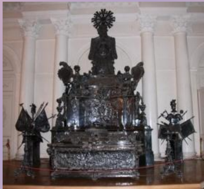
Гробница в Эрмитаже