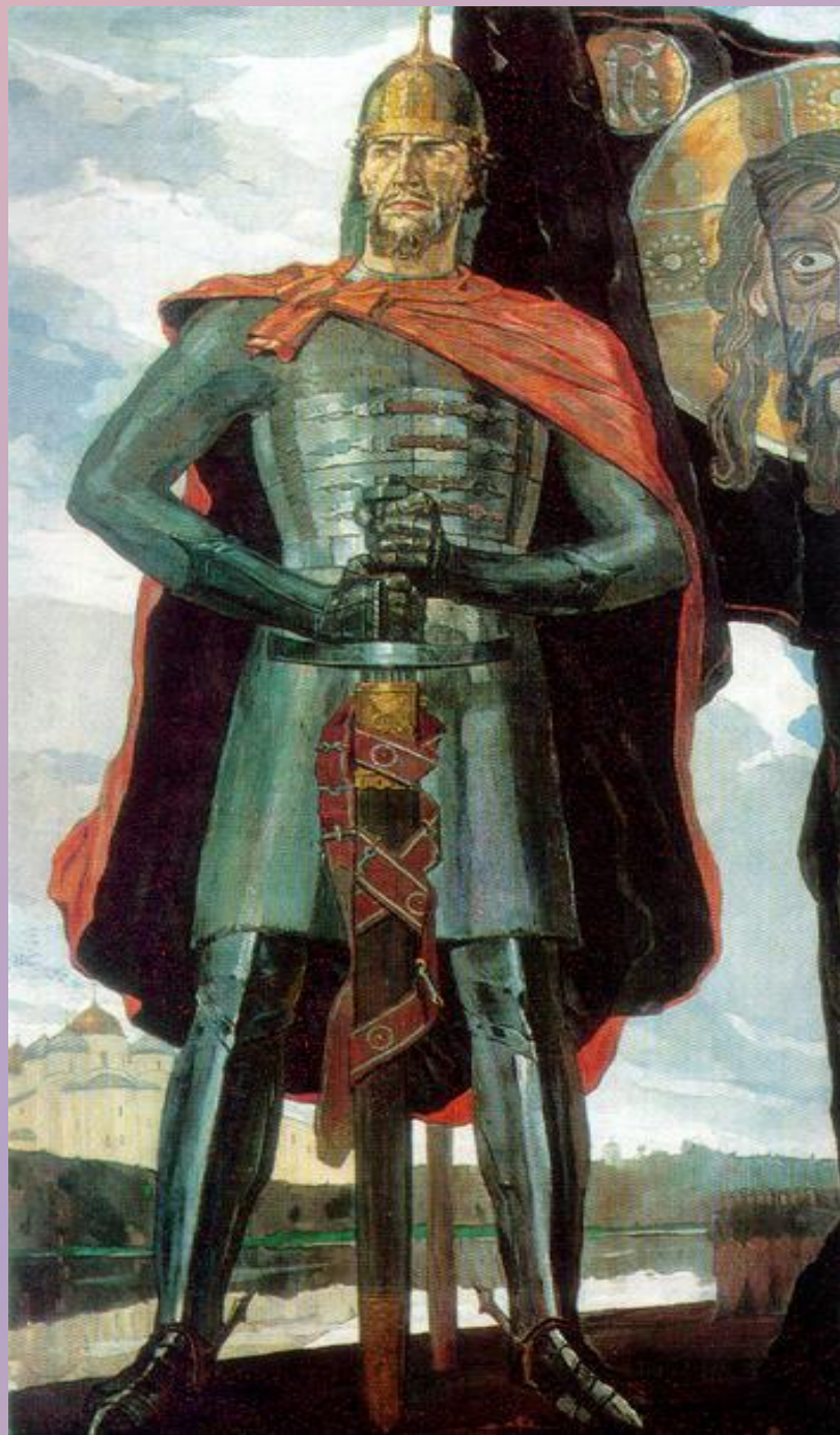
Александр Невский (Павел Корин)