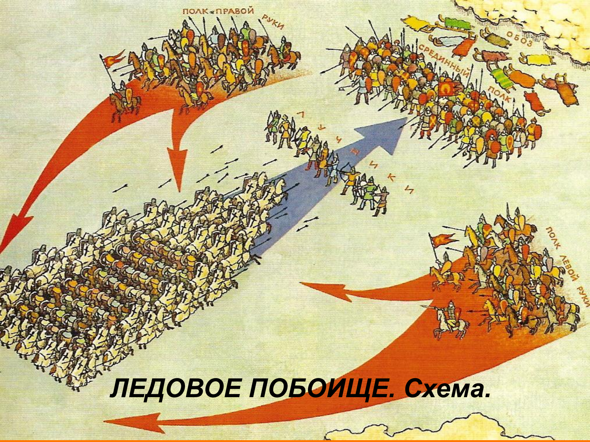
ЛЕДОВОЕ ПОБОИЩЕ. Схема.