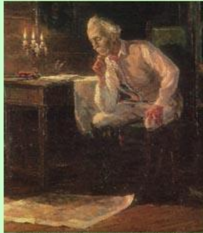
"А.В.Суворов в селе Кончанском". Художник Л.Вашля.

Суворов: «Русские прусских всегда бивали, что ж тут перенять?», «Пудра не порох, букля не пушка, коса не тесак, и я не немец, а природный русак».