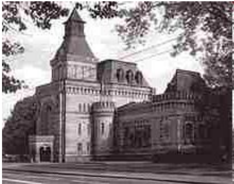
Мемориальный музей Суворова в Санкт-Петербурге