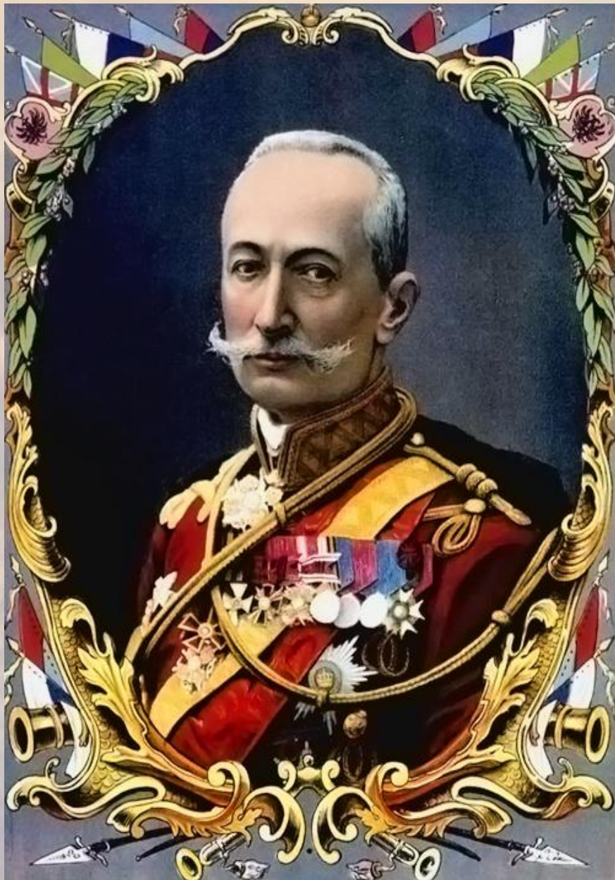
Литография. Типография М.Д. Сытина. Москва, 1916 г.

Генеральское прошлое послужило причиной ареста Брусилова органами ЧК в августе 1918 г. Благодаря ходатайству сослуживцев генерала, уже служивших в Красной Армии, Брусилов был вскоре освобожден, но до декабря 1918 г. находился под домашним арестом. В это время его сын, бывший офицер-кавалерист, был призван в ряды РККА. Честно сражавшийся на фронтах Гражданской войны, он в 1919 г. во время наступления войск генерала Деникина на Москву попал в плен и был повешен.