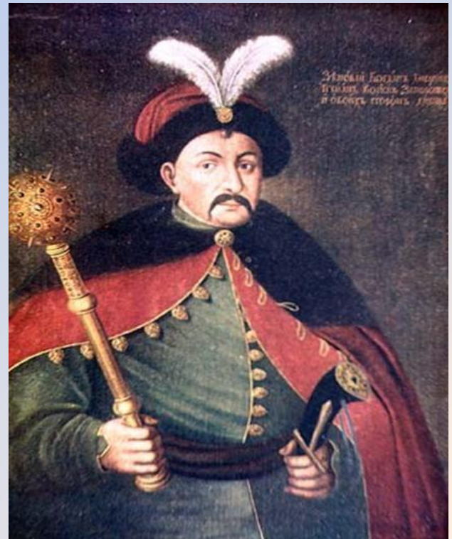
• Богдан Хмельницкий