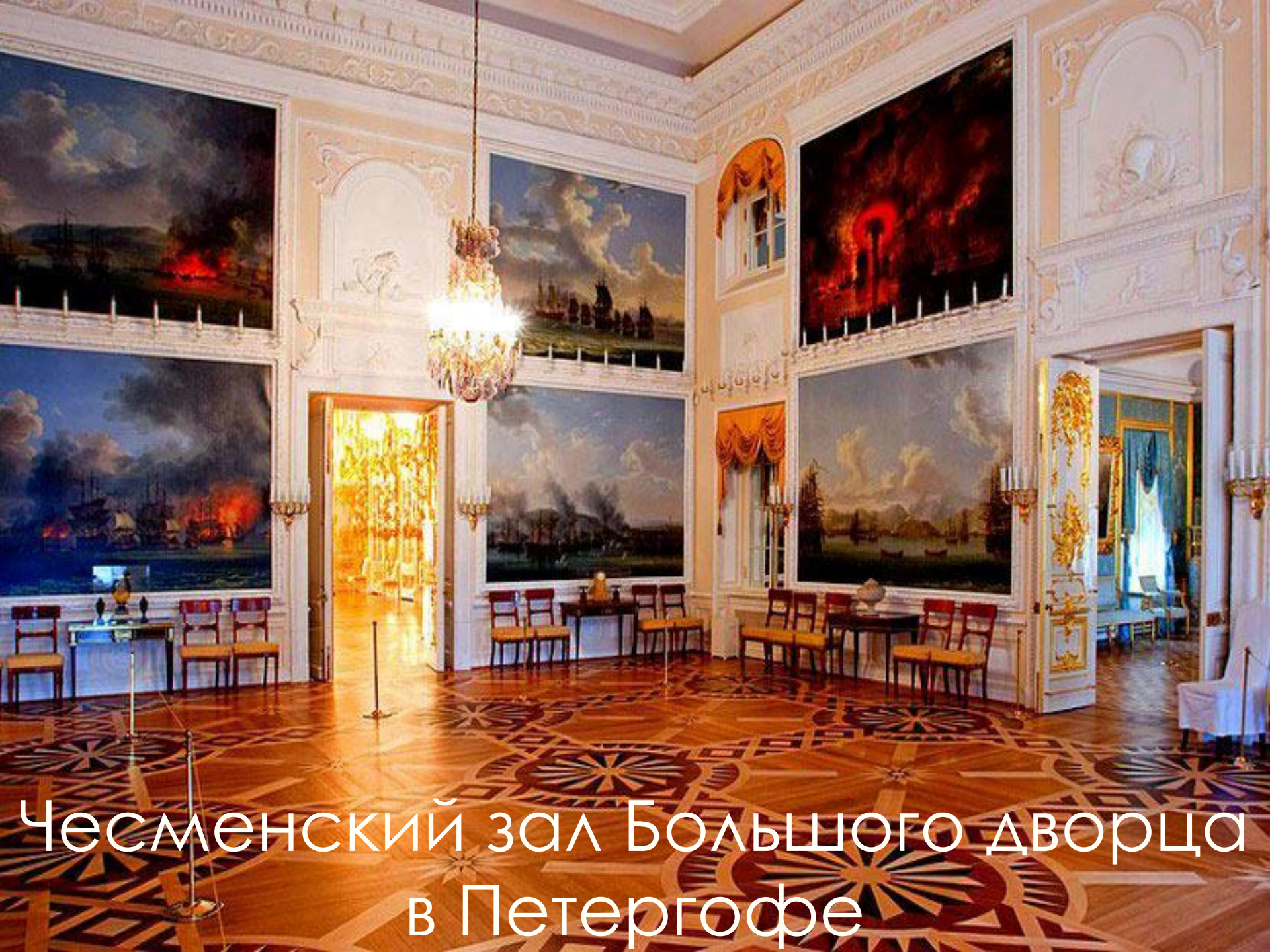
Чесменский зал Большого дворца в Петергофе