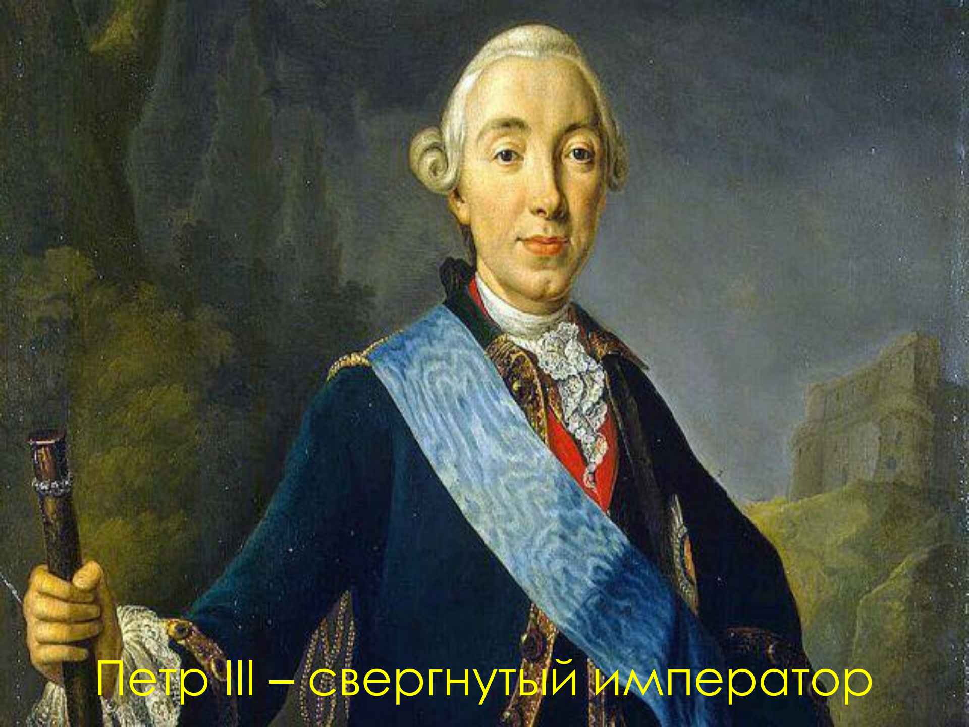
Петр III – свергнутый император