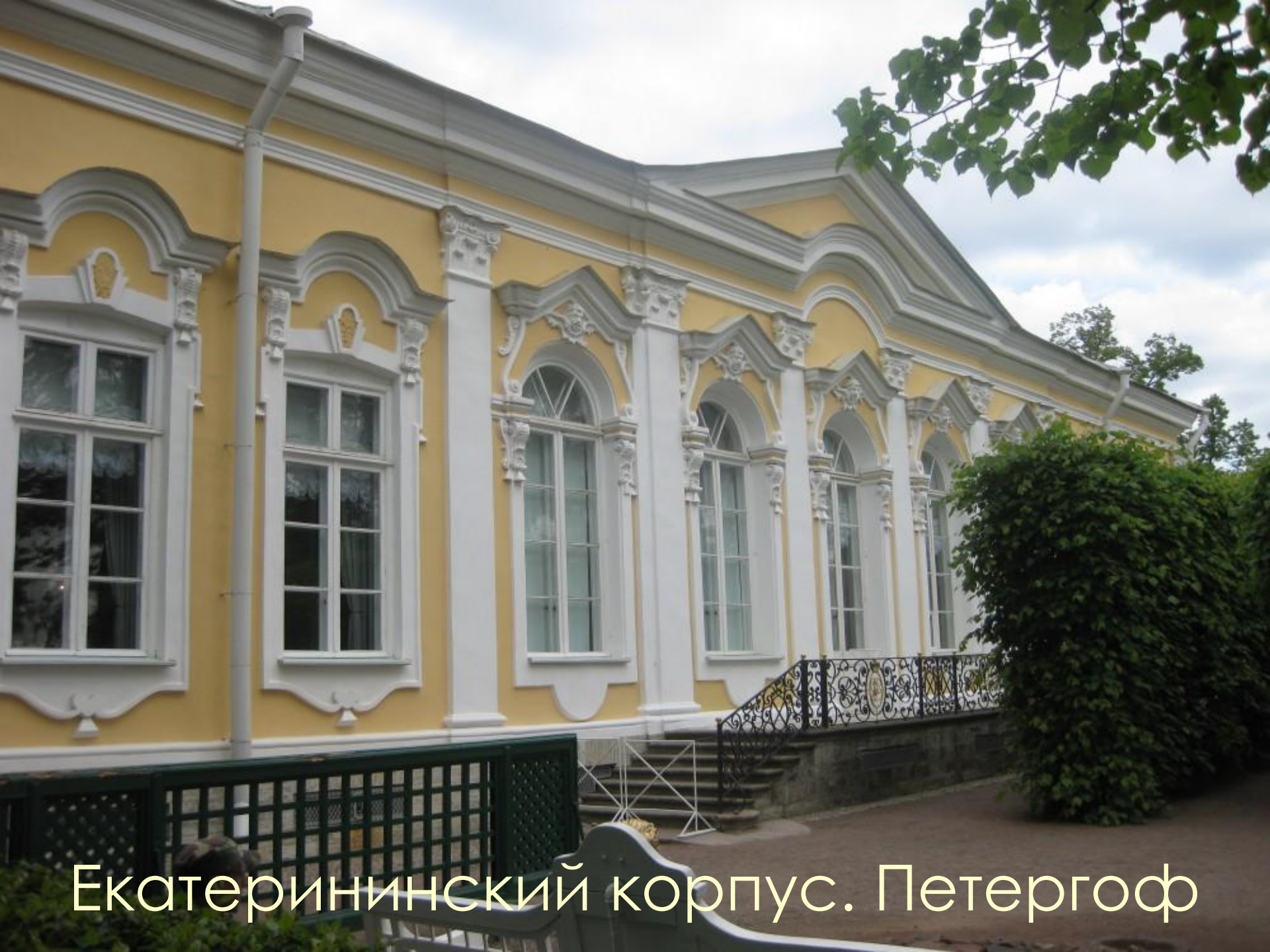
Екатерининский корпус. Петергоф