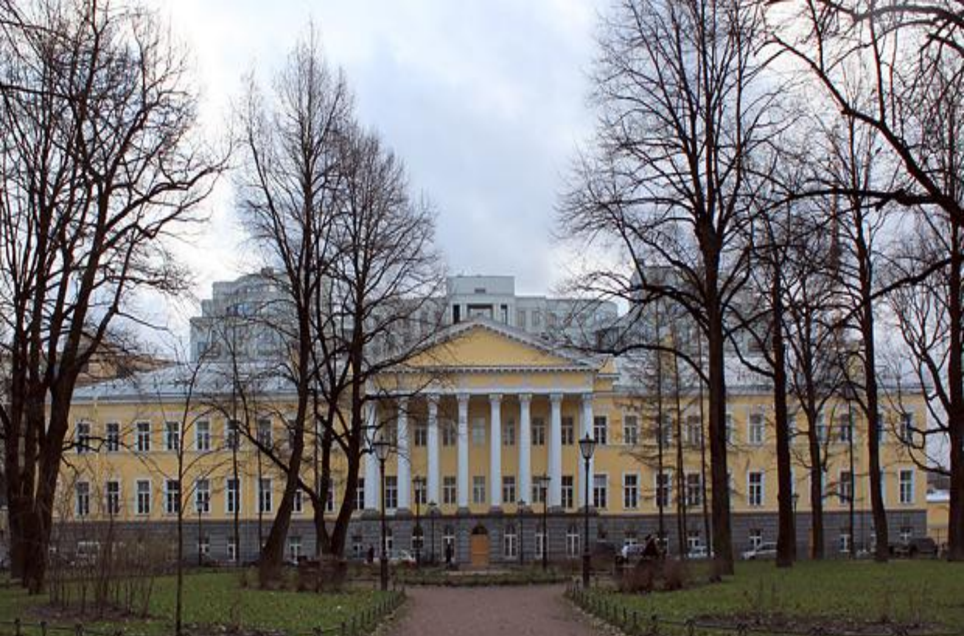
Казармы Преображенского полка