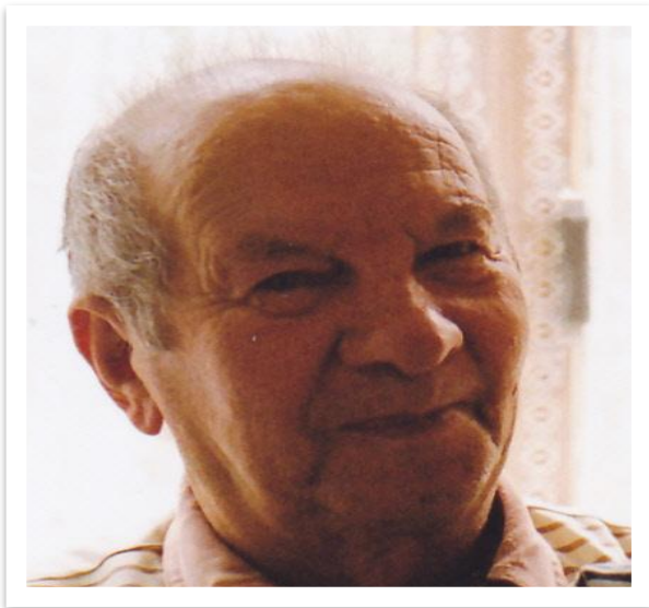
Рагозин Анатолий Иванович