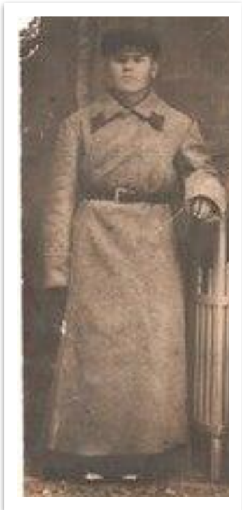
Овчинников Федор Федосеевич