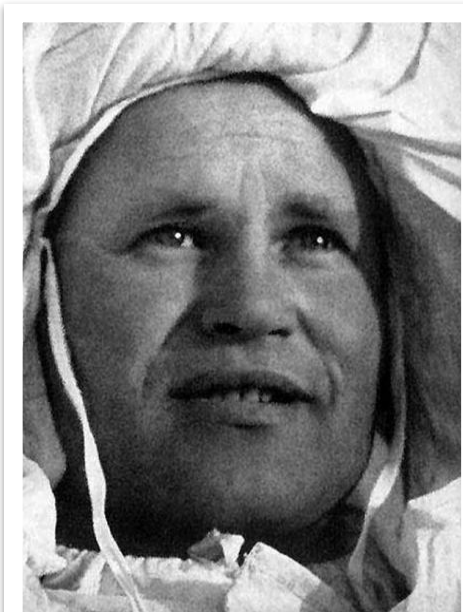
Зайцев Василий Григорьевич