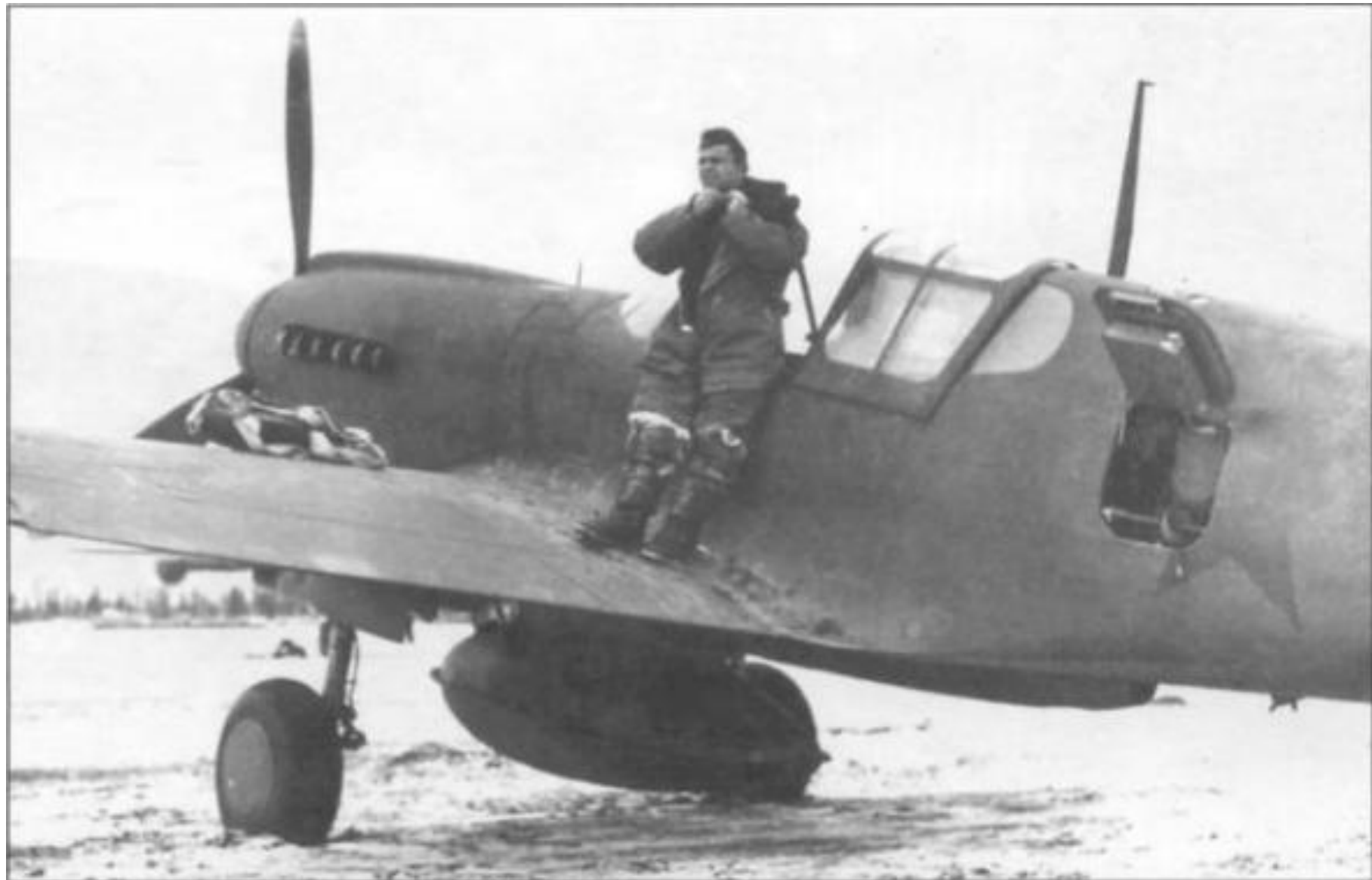
Летчик из 4-го ПАП на крыле «Киттихаука». Обратите внимание на крупный ПТБ под фюзеляжем машины. Только благодаря таким бакам самолеты могли преодолевать большие расстояния между редкими сибирскими аэродромами