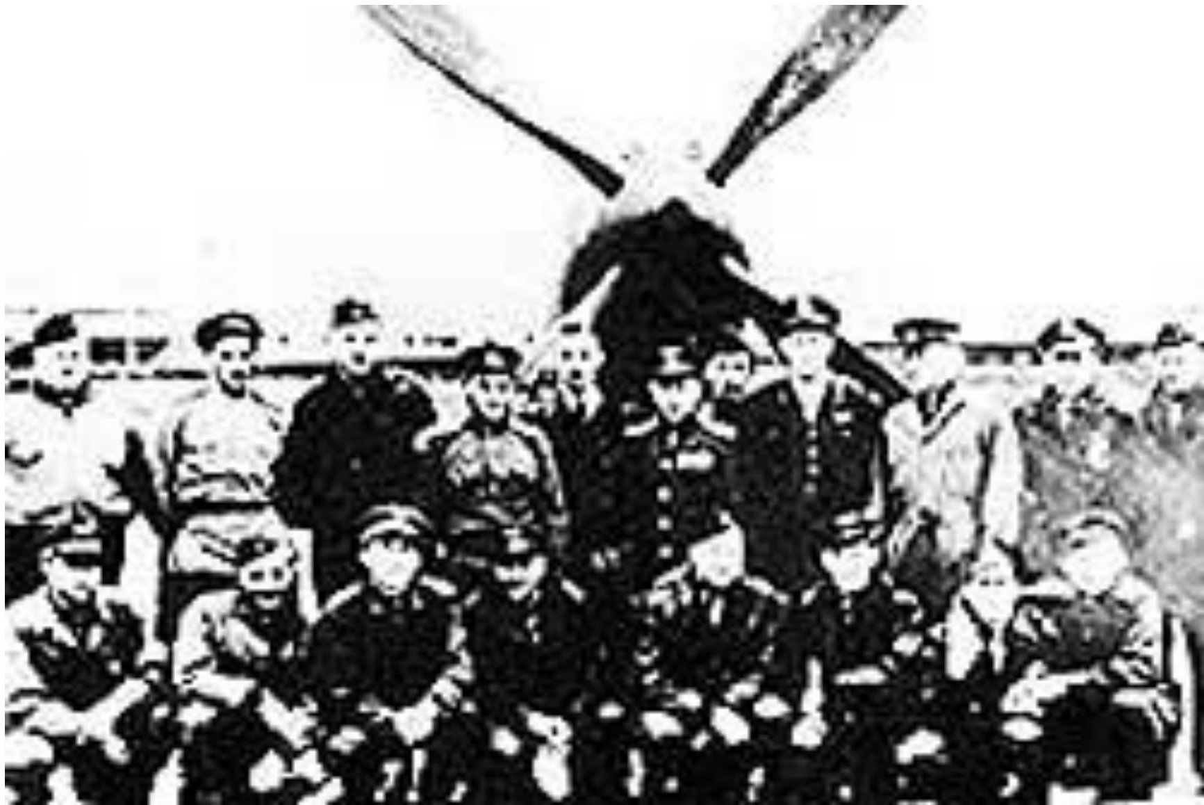
ПЕРВЫЙ ПЕРЕГОНОЧНЫЙ АВИАПОЛК