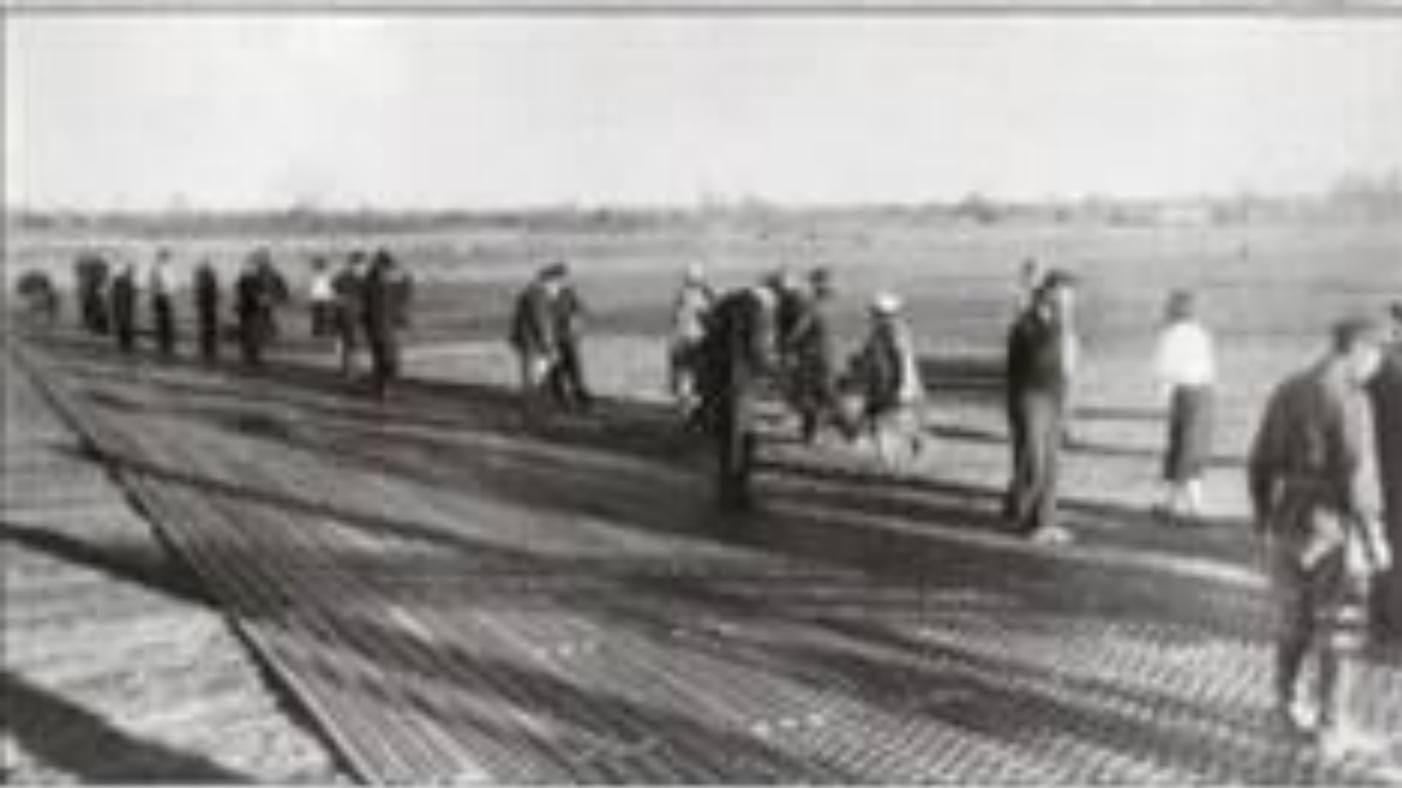
1944Г. УКЛАДКА МЕТАЛЛИЧЕСК ОЙ ПОЛОСЫ НА АЭРОДРОМЕ ТАРНЮР