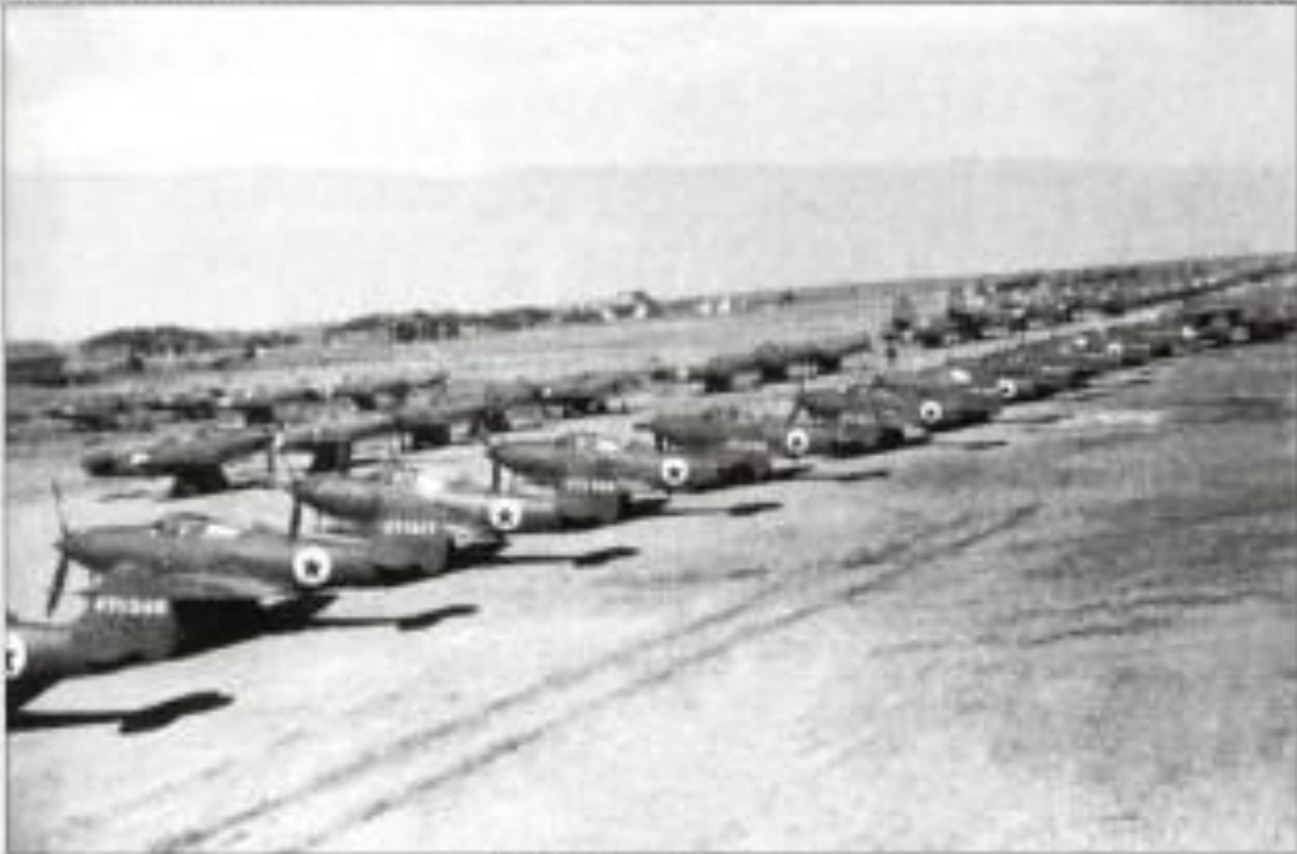
Истребители У-2 перед вылетом на аэродроме Уэлькаль