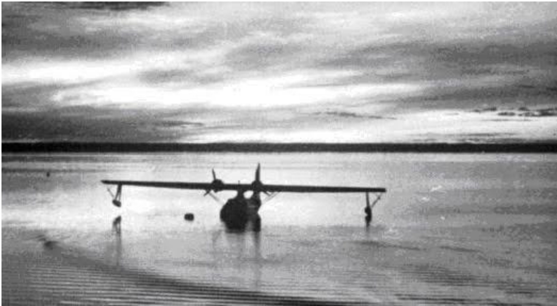
ГИДРОСАМОЛЁТ «КАТАЛИНА» НА ЛЕНЕ 1943 Г.