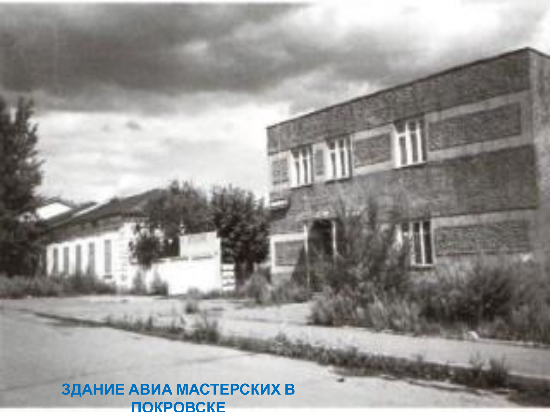
ЗДАНИЕ АВИА МАСТЕРСКИХ В ПОКРОВСКЕ