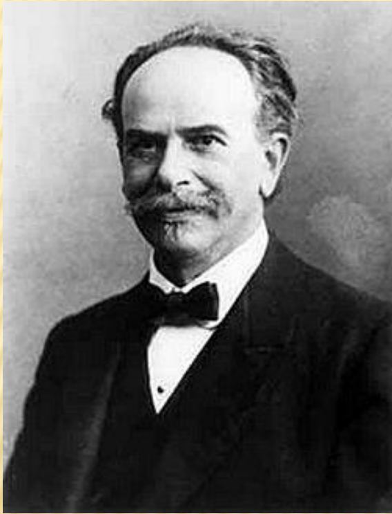
Франц Боас , 9 июля 1858, Минден — 21 декабря 1942 Нью-Йорк

Американская антропологическая школа подразделяется на: историческую (Боас, Крёбер, Уисслер, Лоуи), этнопсихологическую (Кардинер, Бенедикт, М. Мид и др.), культурно-эволюционную (Л. Уайт, М. Салинс, Э. Сервис, Дж. Стюард и др.)