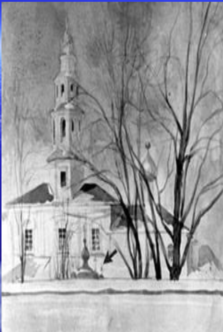
Покровский мужской монастырь