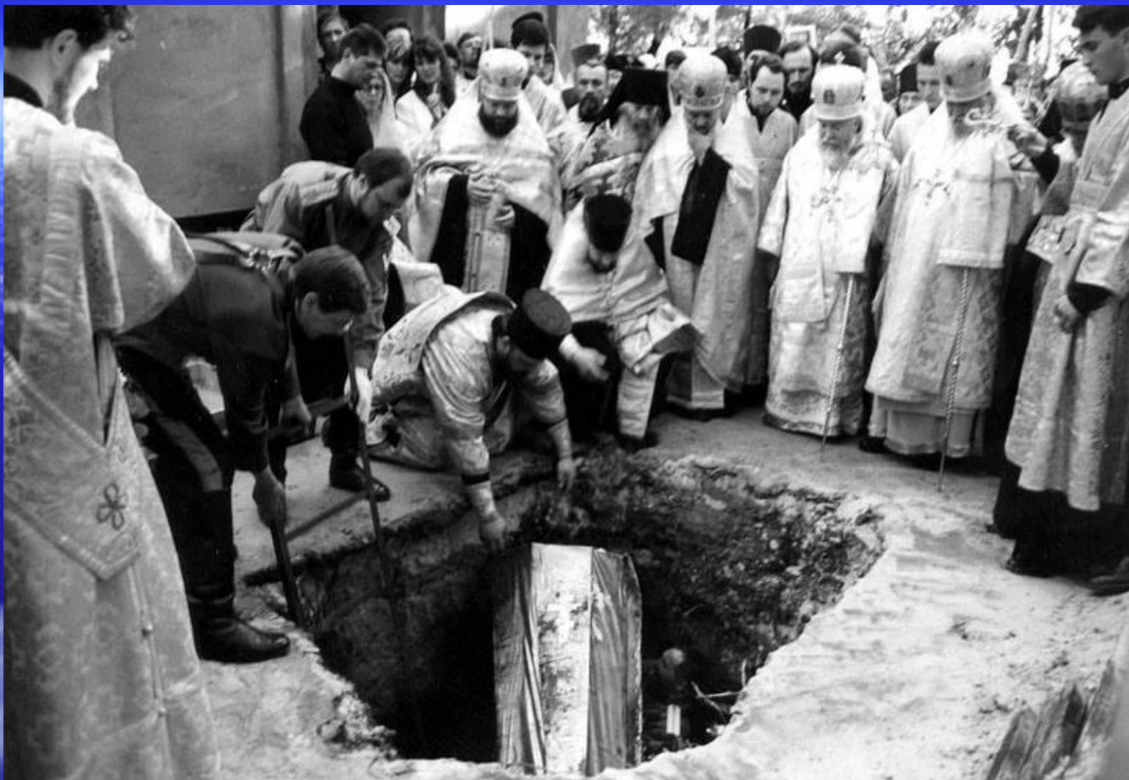
Обретение мощей святого блаженного Андрея 3 июня 1998 года.