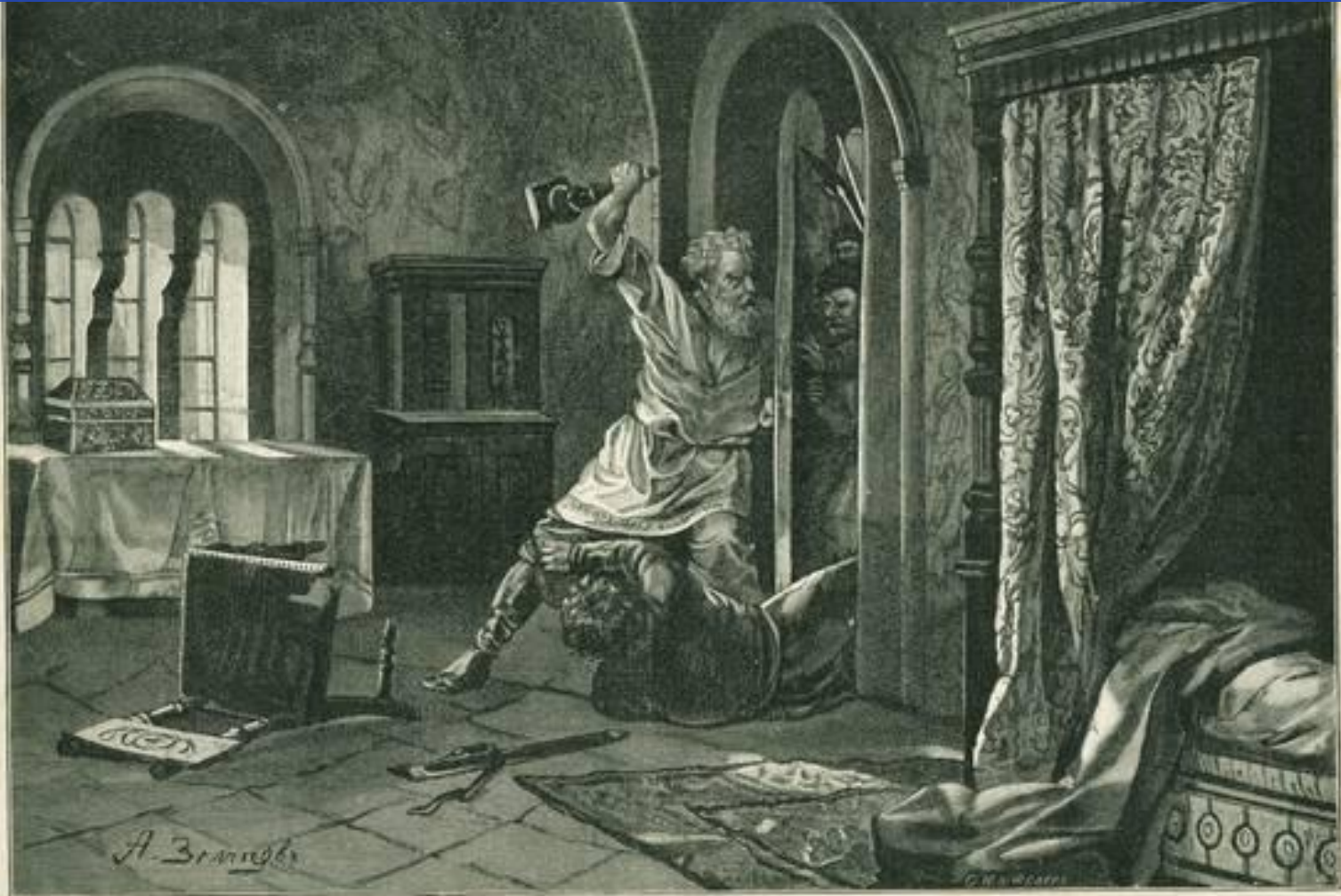
Смерть Великого князя Андрея Боголюбского (1174 г.).

Разорённый и разграбленный город навсегда утратил своё былое значение центра Руси, а главенство в русских землях окончательно перешло к Владимиру. Деспотичный характер Боголюбского, его жёсткое, а подчас и жестокое обращение с приближёнными, ссоры с церковными иерархами привели к тому, что против него составилась заговор, в котором участвовали его наиболее близкие бояре и слуги.