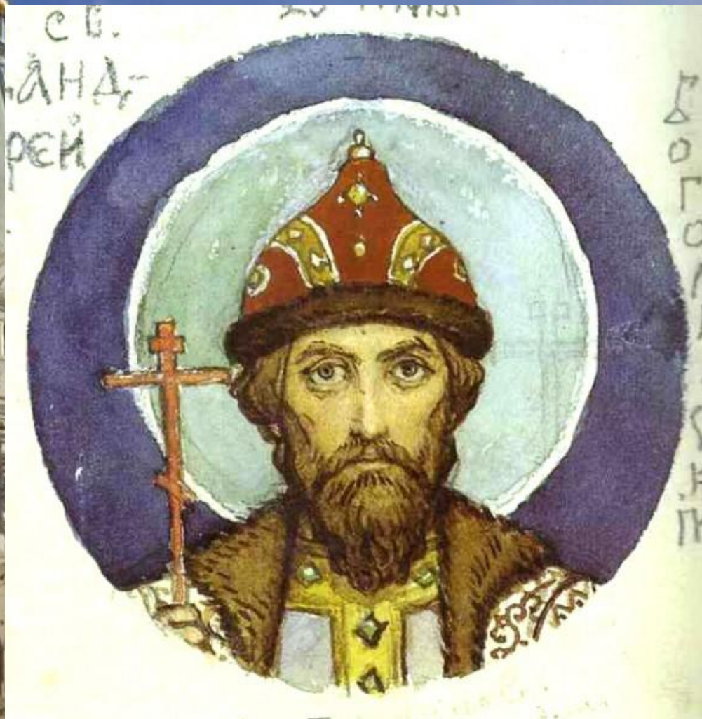
Андрей Боголюбский, великий князь владимирский с 1157 г.