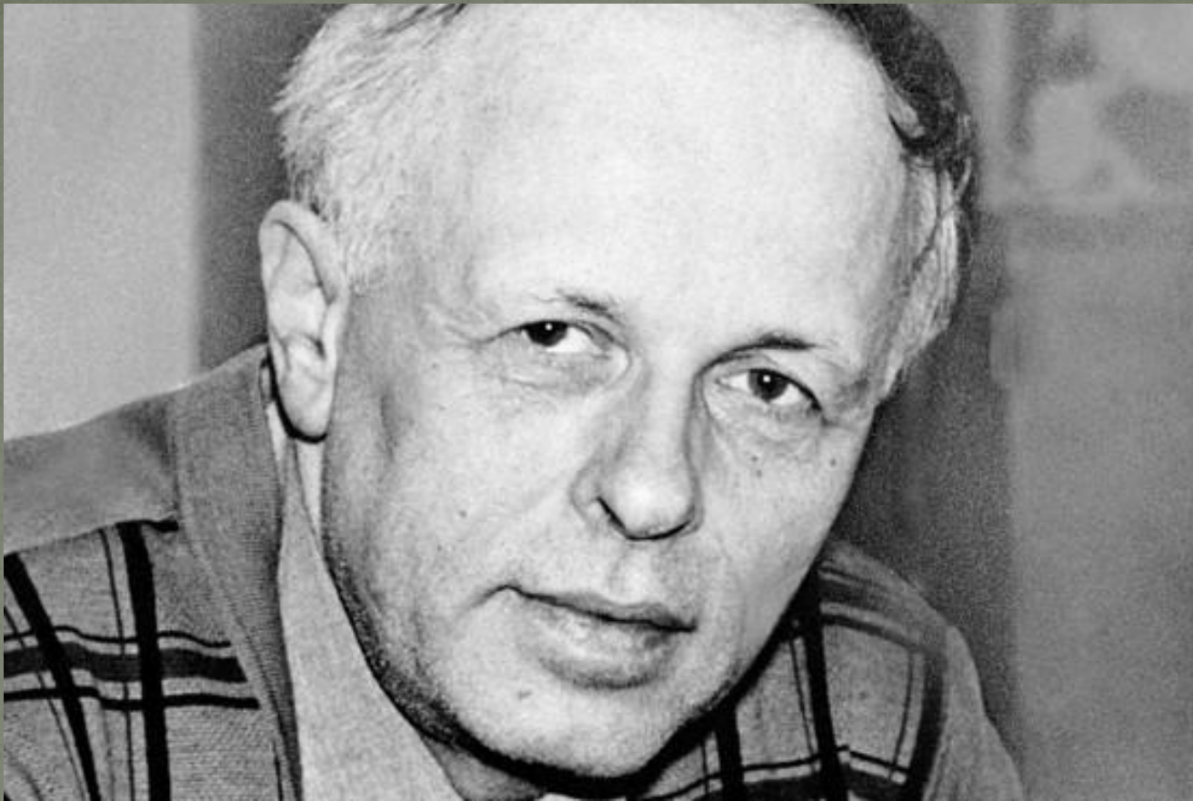
Андрей Дмитриевич Сахаров