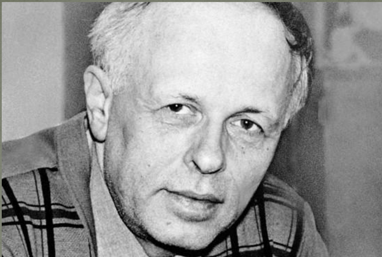
Андрей Дмитриевич Сахаров