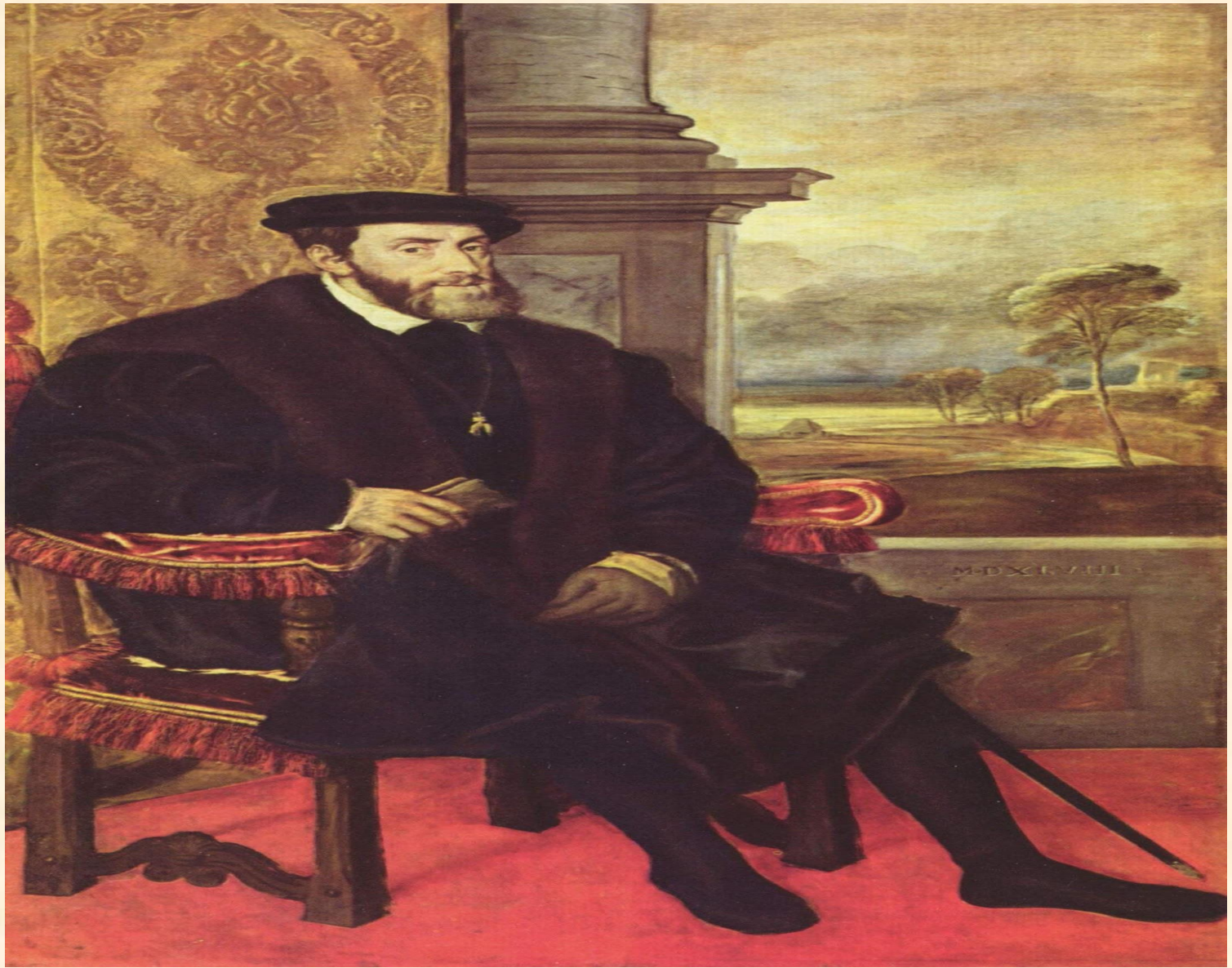
Карл I Испанский (Карл V император СРИ ) 1516-1556 гг.