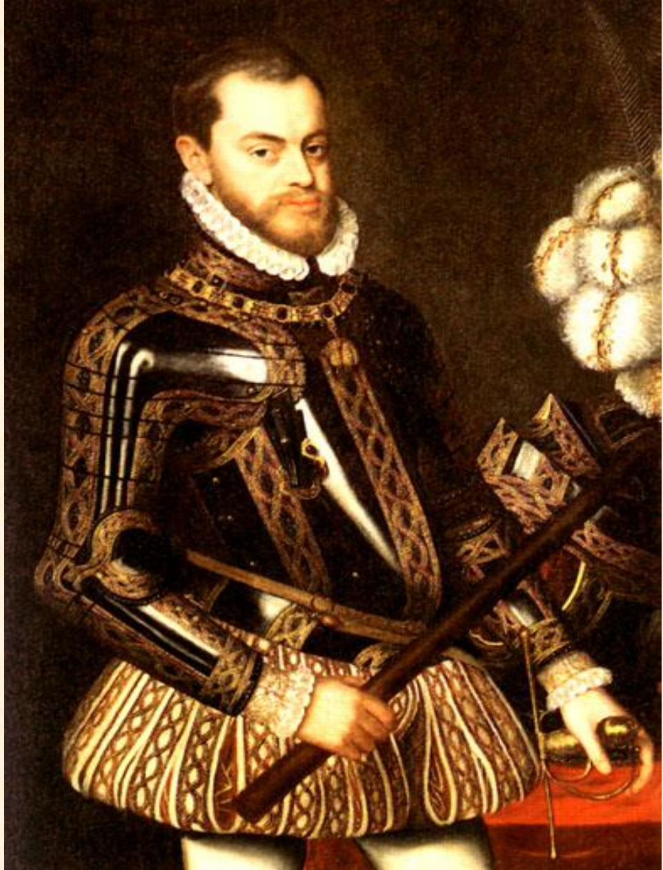
Фердинанд I император СРИ и король Испании Филипп II

PROXIMVS A SVMMO FERDINANDVS CAESARE CARLO REX ROMANORVM SIC TVLIT ORA GENAS AET SVAE XXIX ANN M D XXXI L. de Medina pinxit