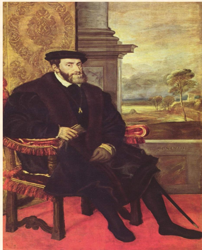
Генрих VIII Английский и Карл V император СРИ