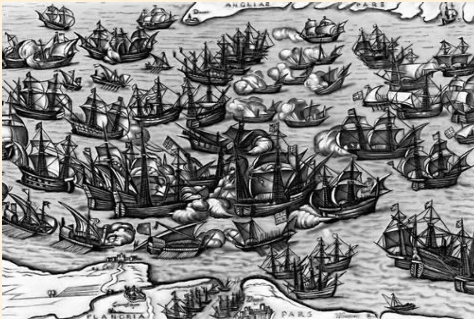
Испанская “Непобедимая армада”