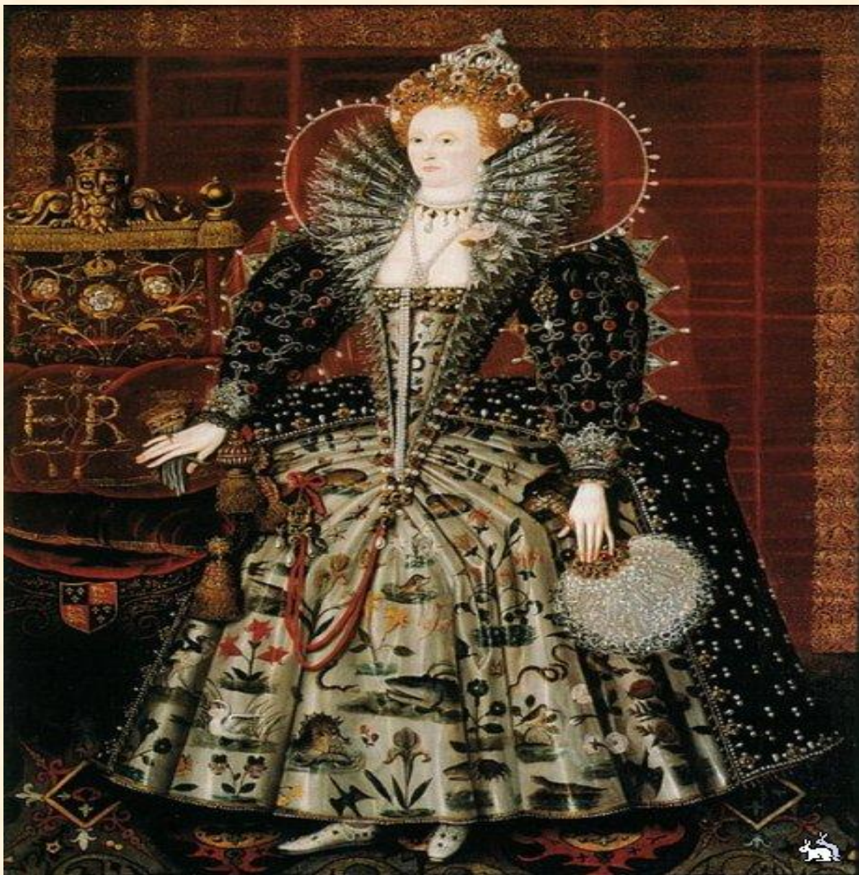
Елизавета I Английская (1558-1603 гг.).