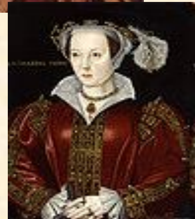
Генрих VIII и его 6 жен