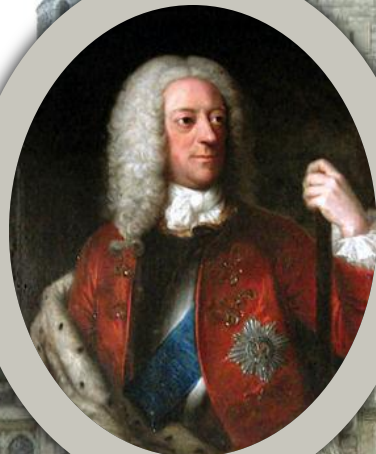
Георг II George II August