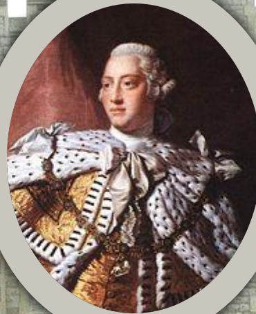
Георг III George William Frederick