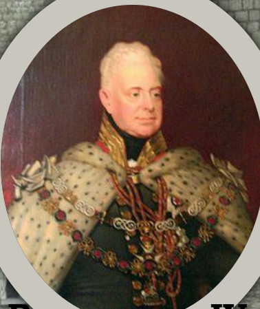
Вильгельм IV William Henry