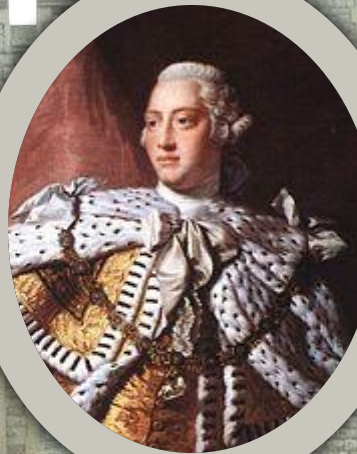
Георг III George William Frederick