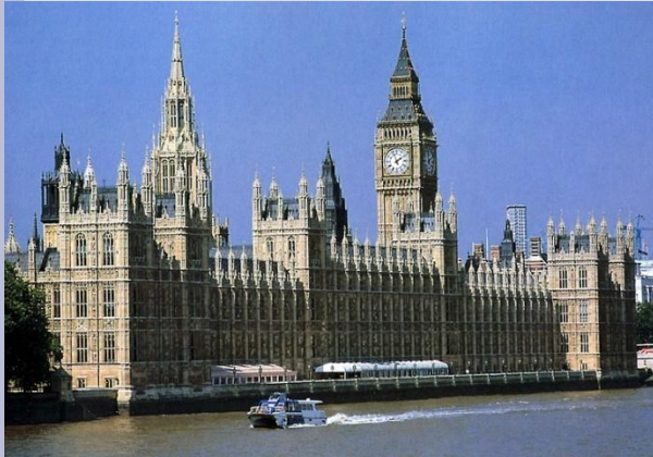
Парламент в Англии