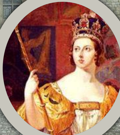
Виктория Alexandrina Victoria