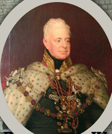
Вильгельм IV William Henry