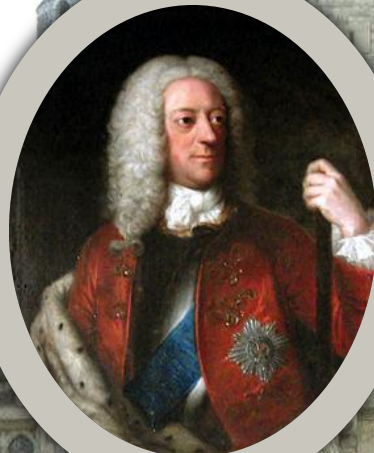
Георг II George II August