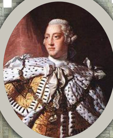
Георг III George William Frederick