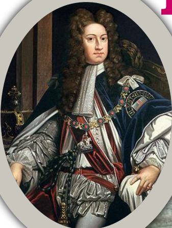
Георг I Georg Ludwig von Hannover