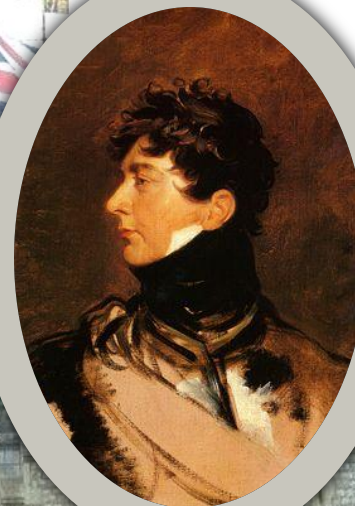
Георг IV George IV