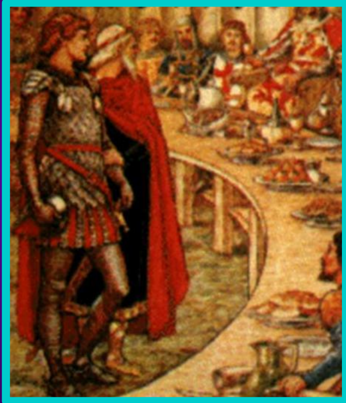
Король Артур и рыцари Круглого Стола

Ранняя история Англии известна по легендам о Короле Артуре.