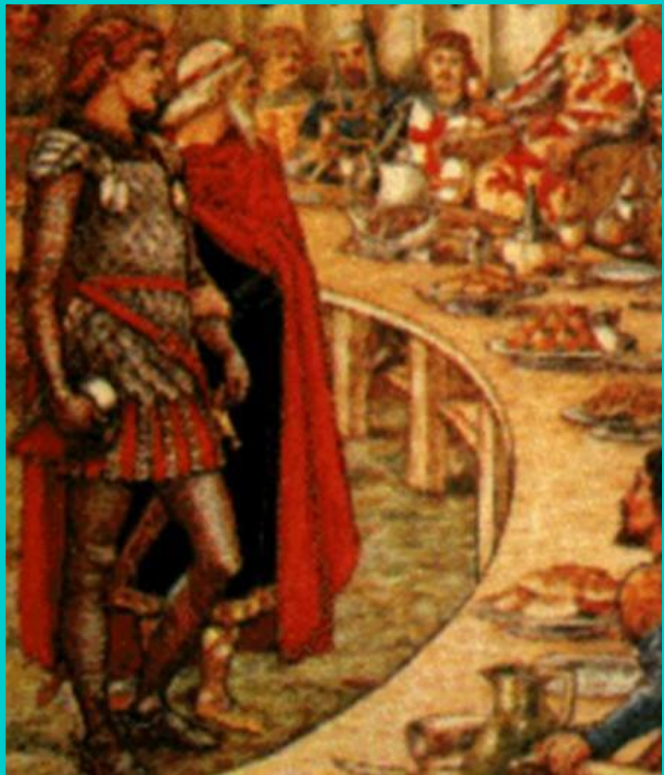
Король Артур и рыцари Круглого Стола

Ранняя история Англии известна по легендам о Короле Артуре.