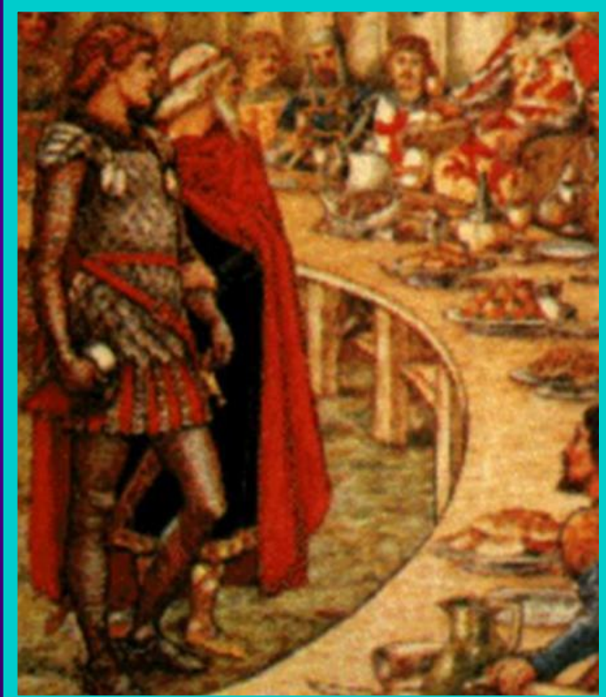
Король Артур и рыцари Круглого Стола

Ранняя история Англии известна по легендам о Короле Артуре.