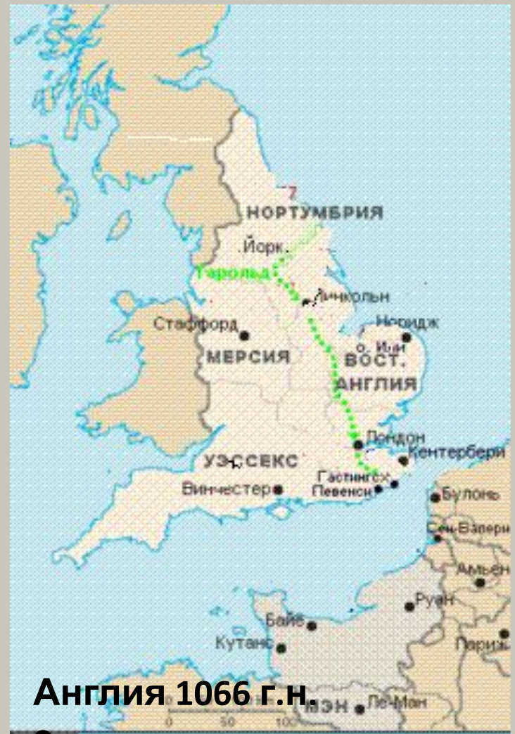
Англия 1066 г.н.