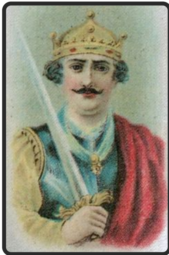
Вильгельм Завоеватель(1066 - 1087)