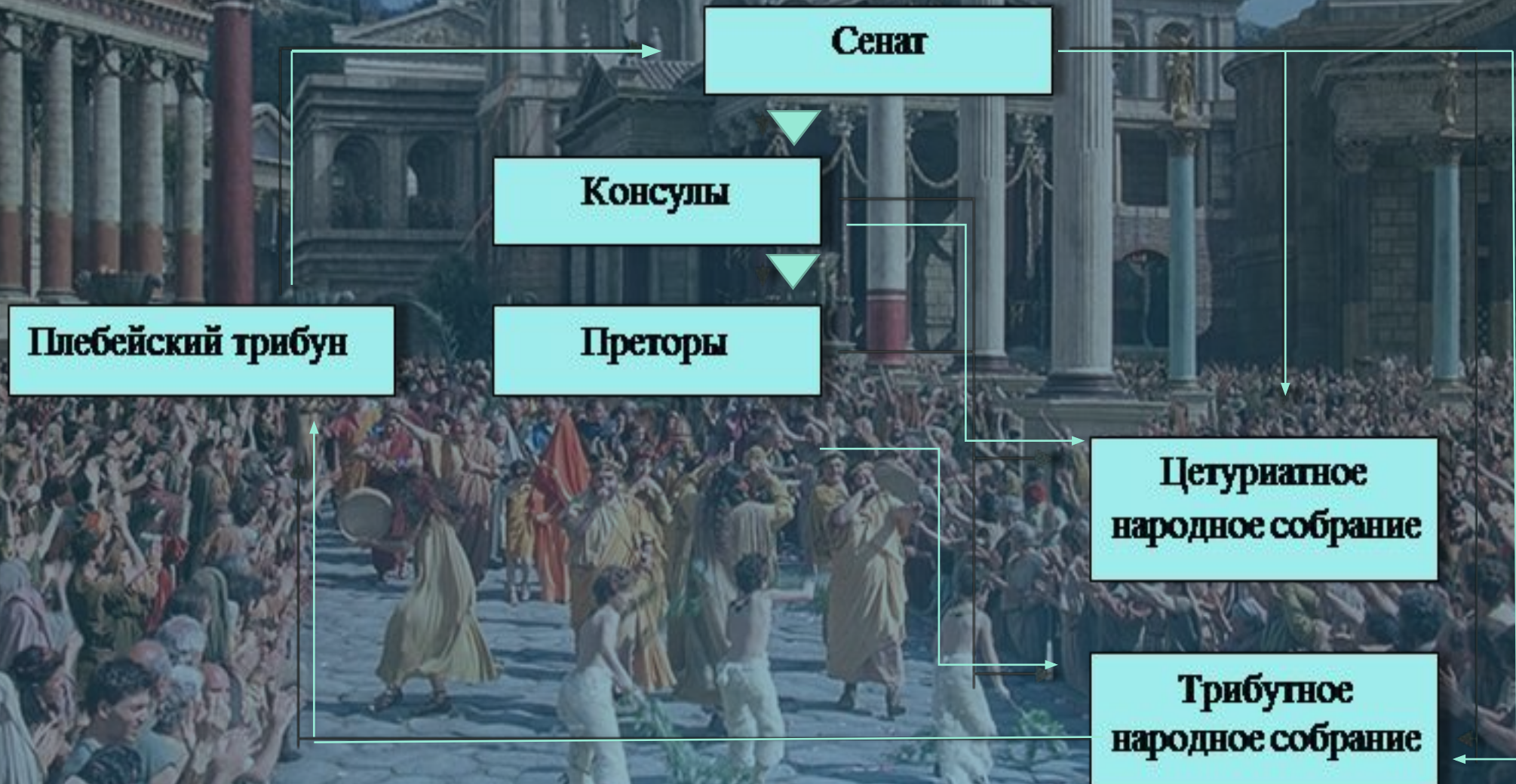
Схема политической власти Римской республики