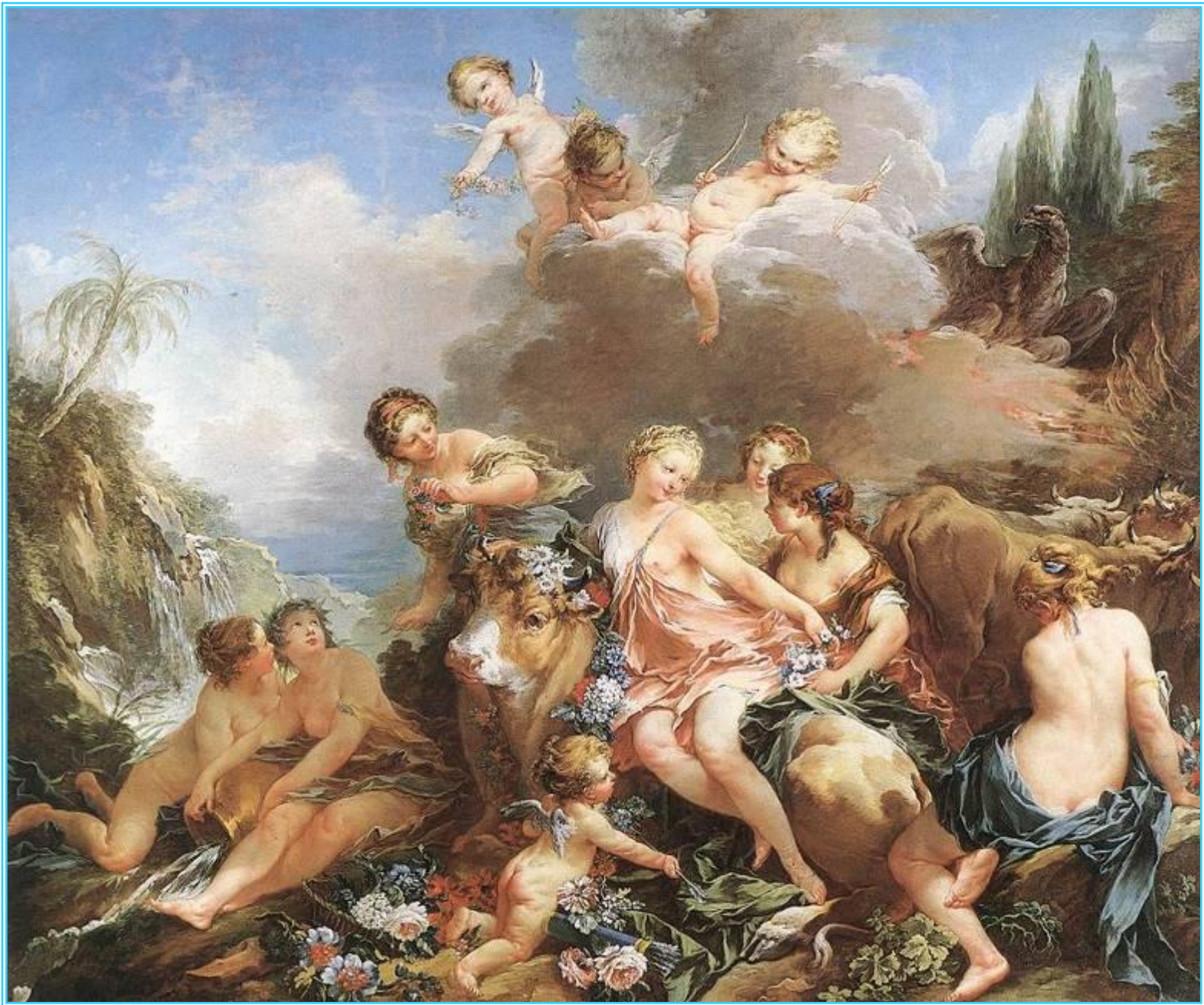
Франсуа Буше. Похищение Европы