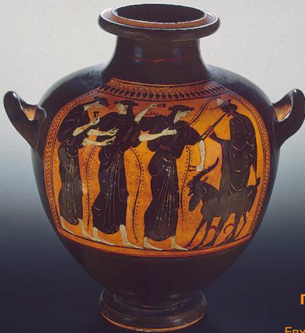
Гидрия. Гермес и менады Евхарид 490-е гг. до н.э.