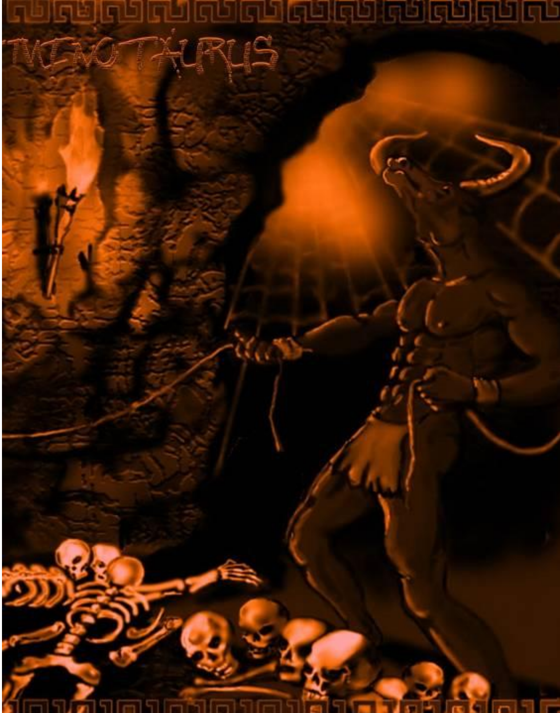
Легенда о Минотавре