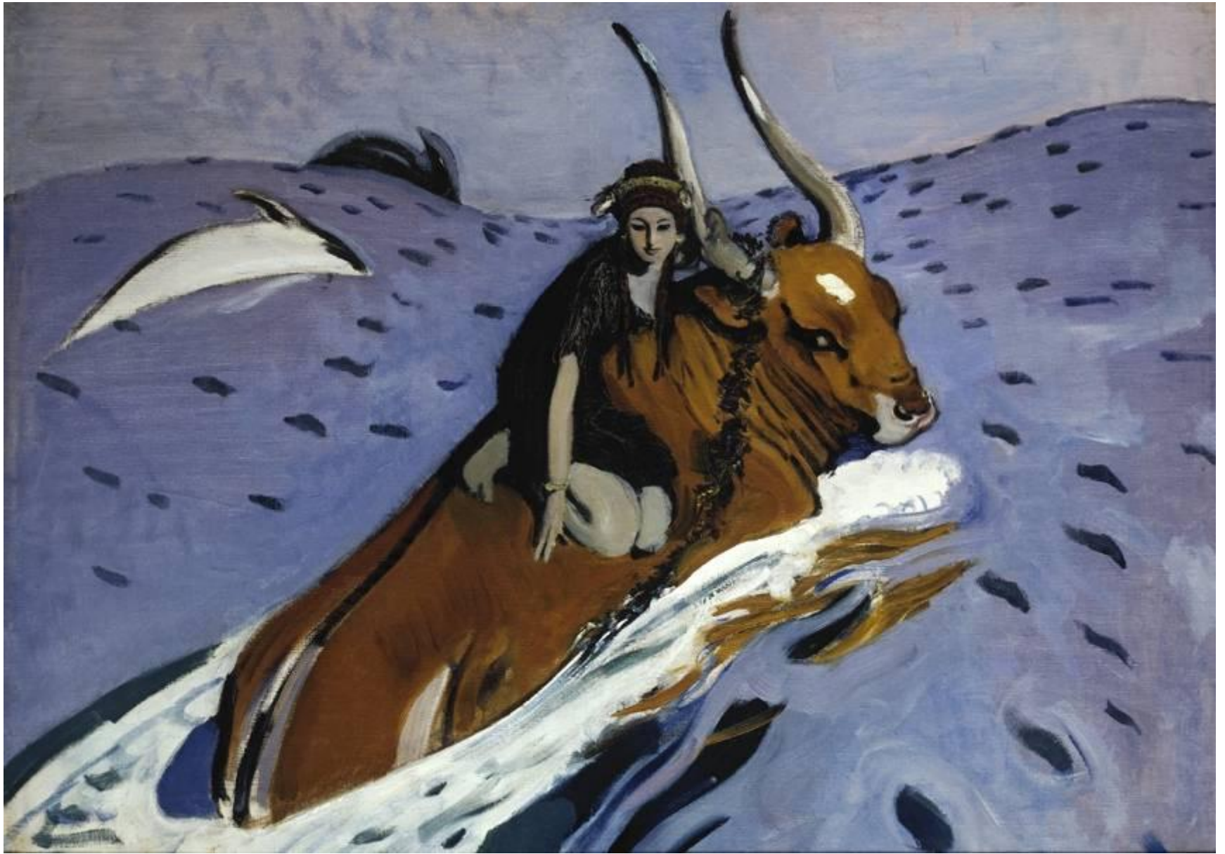
В.Серов. Похищение Европы.