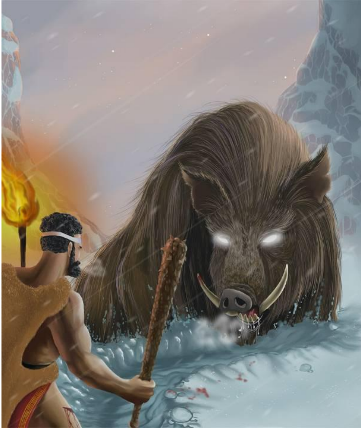
Геракл и Эриманфский кабан