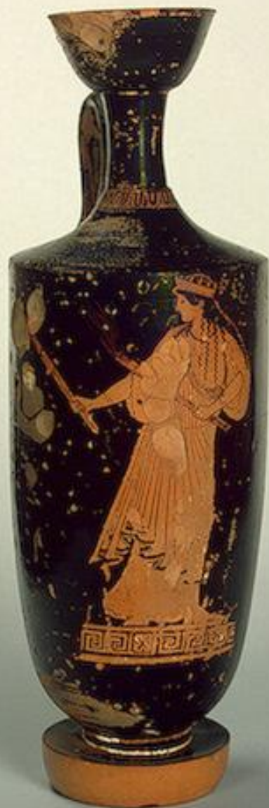
Лекиф. Артемида , Около 480 г. до н.э. Древняя Греция