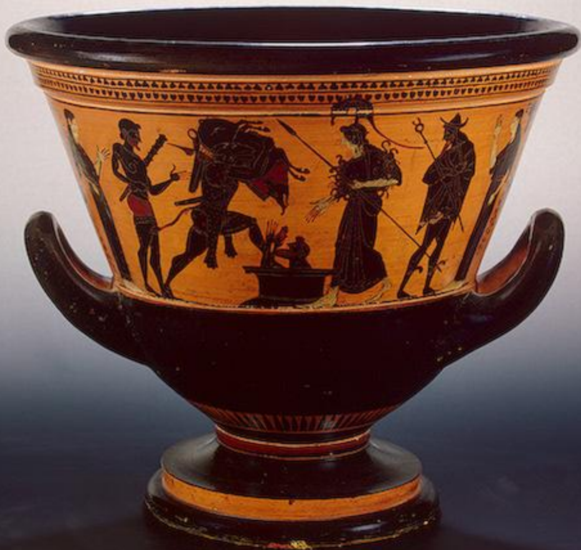
Кратер Круг мастера Антимена Около 500 г. до н.э.