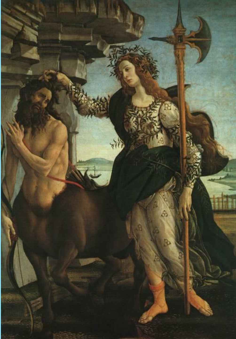
Сандро Боттичелли. Паллада и Кентавр