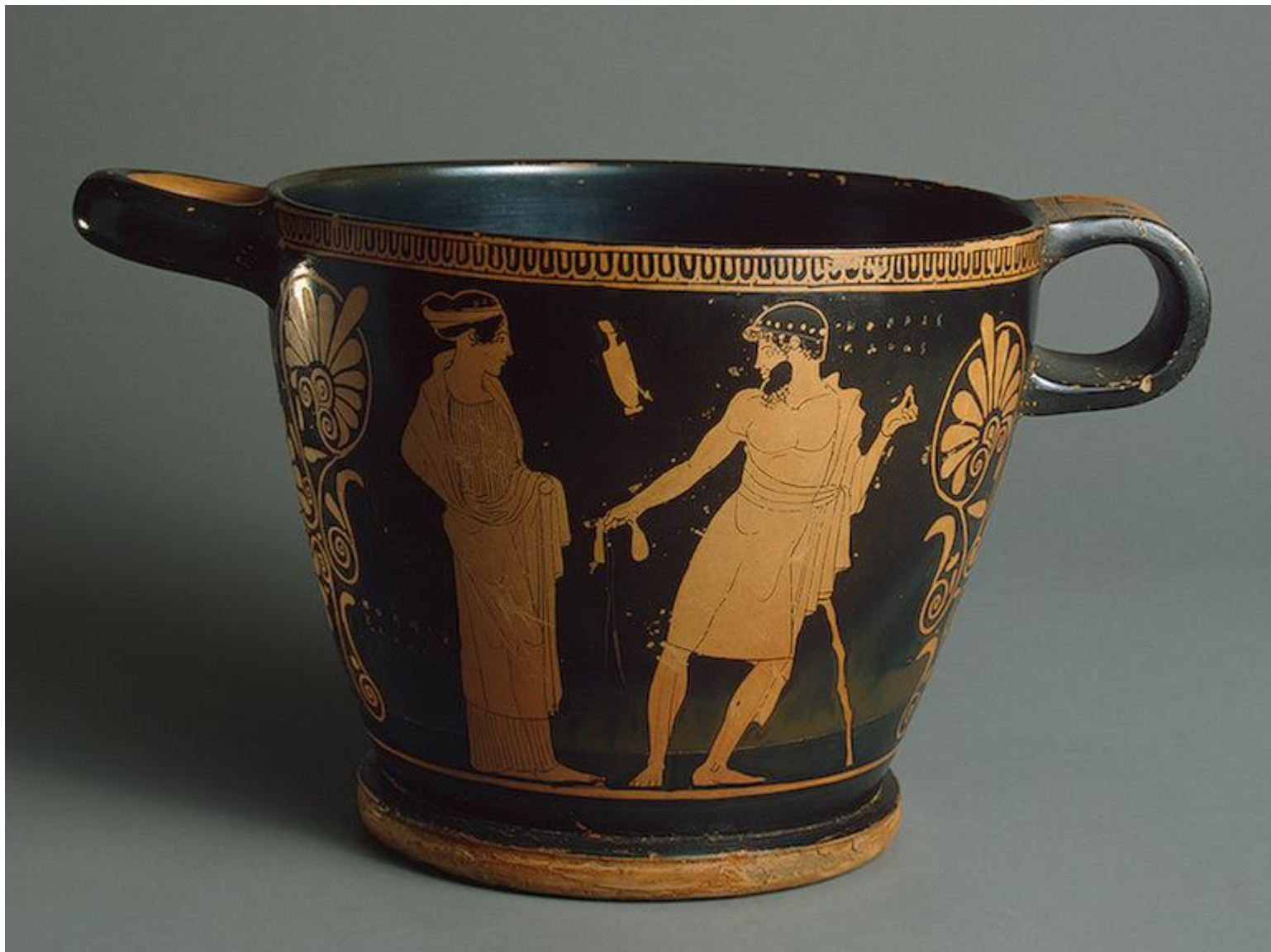
Скифос. Гетера и мужчина. Обрат: гетера и юноша. Около 460 г. до н.э. Древняя Греция