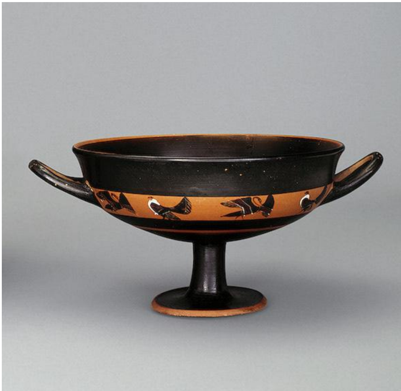
Килик. Птицы. Около 540 г. до н.э. Древняя Греция