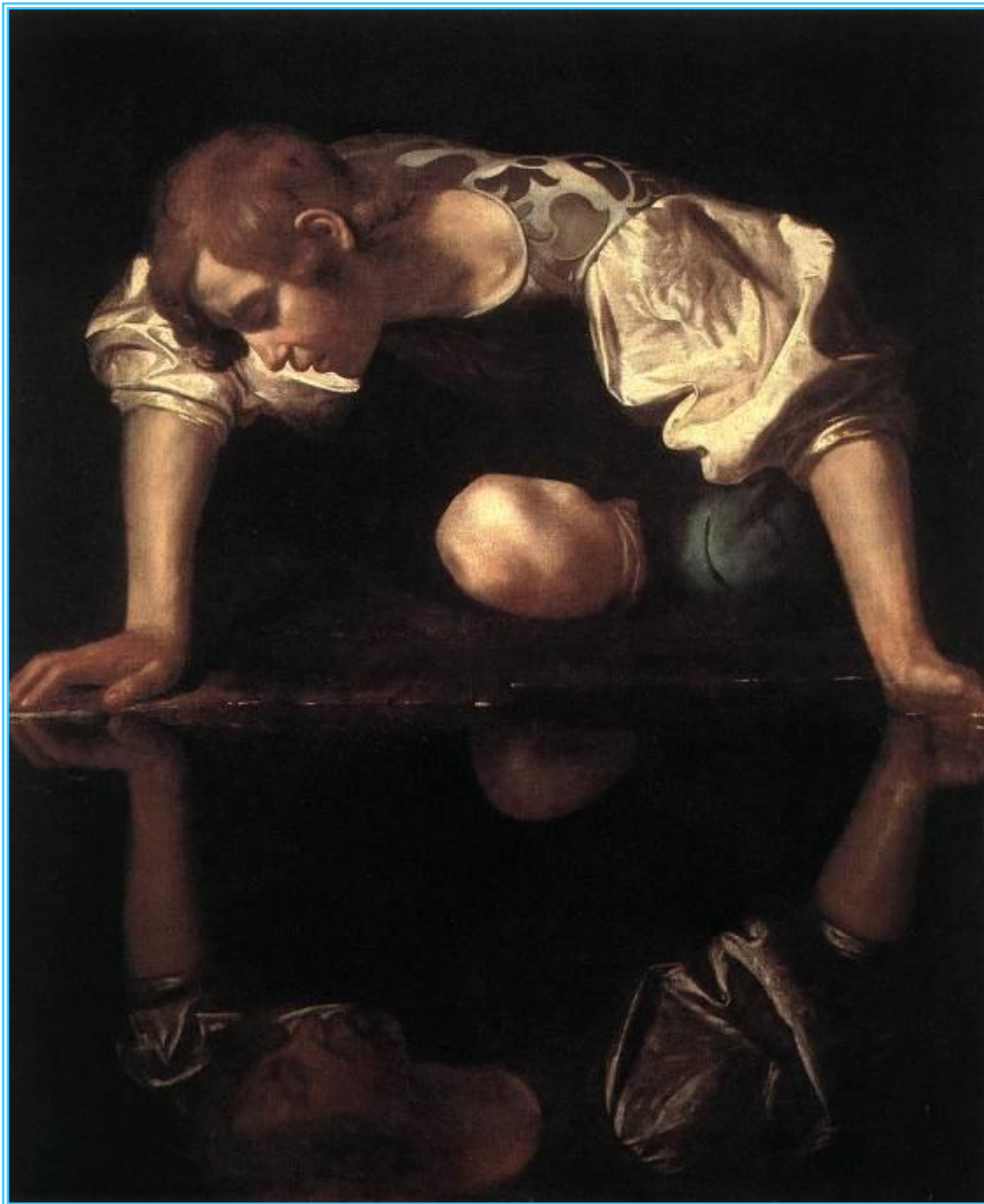
Микеланджело Мериси да Караваджо. Нарцисс.