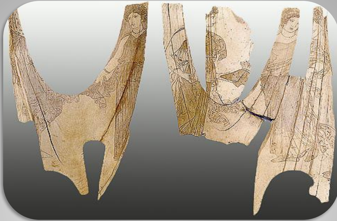
ДЕКОРАТИВНАЯ ПЛАСТИНА "СУД ПАРИСА" КОНЕЦ V В. ДО Н.Э. АТТИКА КОСТЬ