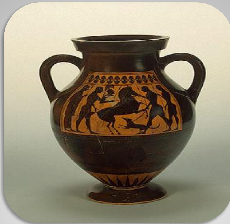
АМФОРА "ВСАДНИК И ВОИНЫ" VI В. ДО Н.Э. МАСТЕР АМАЗИСА. АФИНЫ ГЛИНА