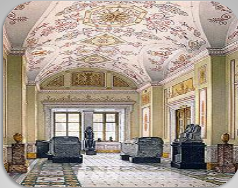
Кабинет египетской скульптуры