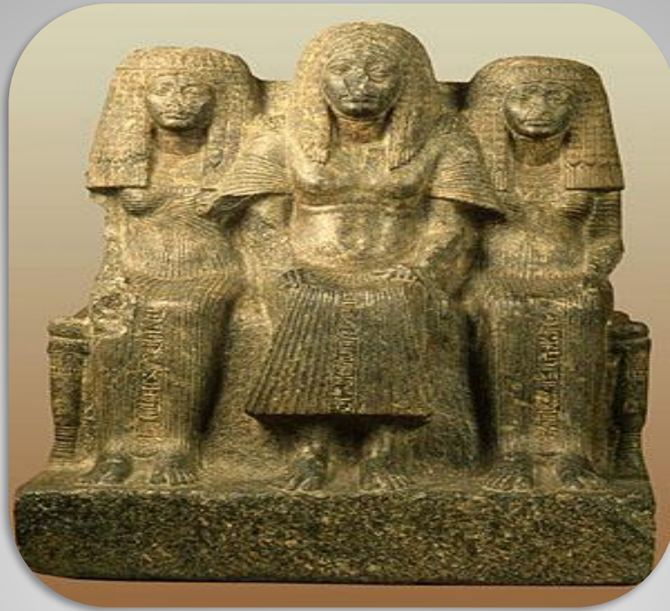
ГРУППА ГРАДОНАЧАЛЬНИКА ФИВ АМЕНЕМХЕБА С ЖЕНОЙ И МАТЕРЬЮ XIV В. ДО Н.Э. ФИВЫ БАЗАЛЬТ