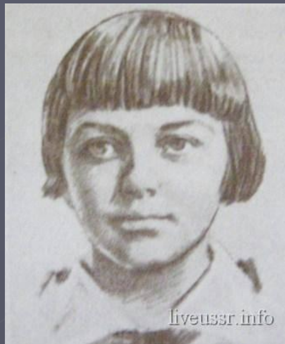
Зина Портнова – Герой Советского Союза