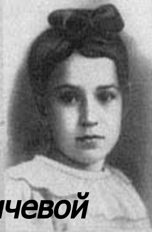
Из дневника Тани Савичевой