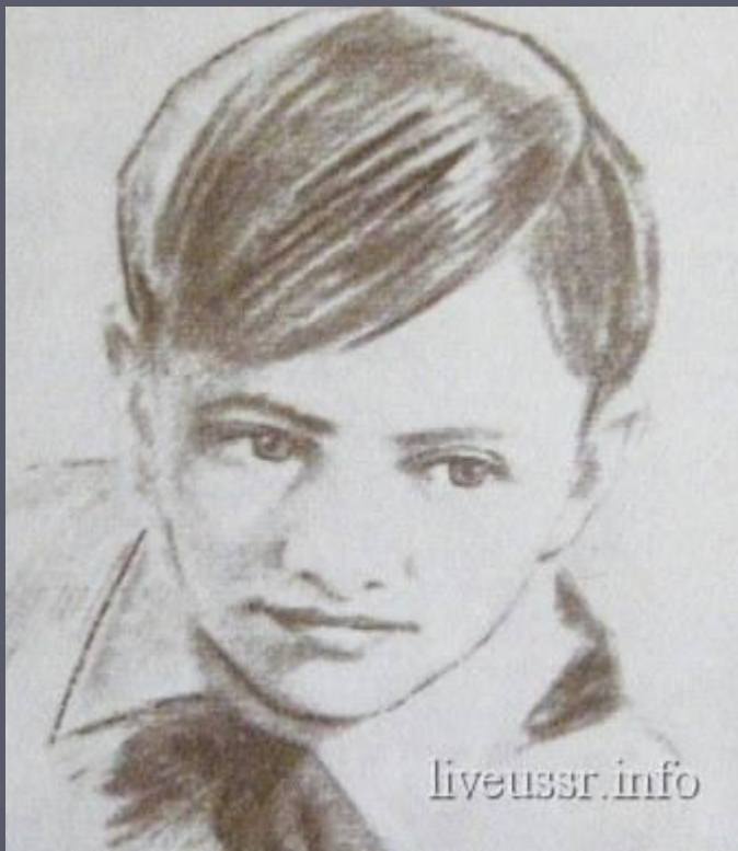
Валя Котик – Герой Советского Союза