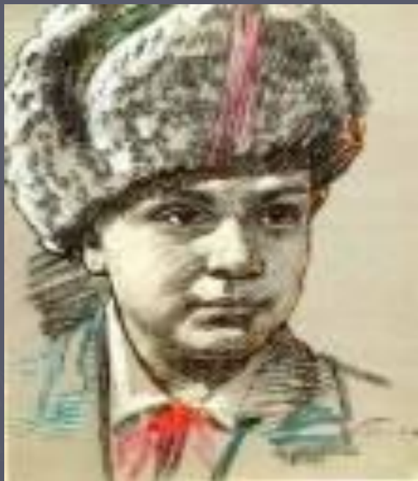
Леня Голиков – Герой Советского Союза