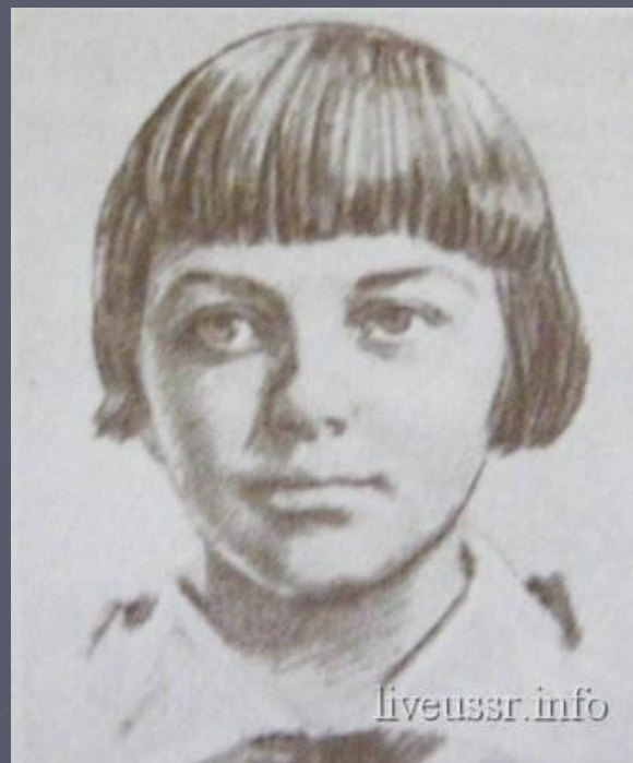
Зина Портнова – Герой Советского Союза