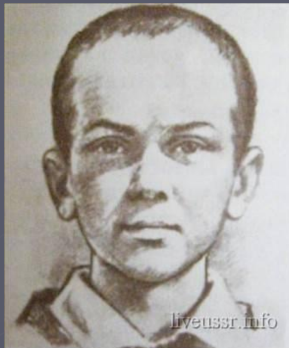
Марат Казей – Герой Советского Союза, партизан