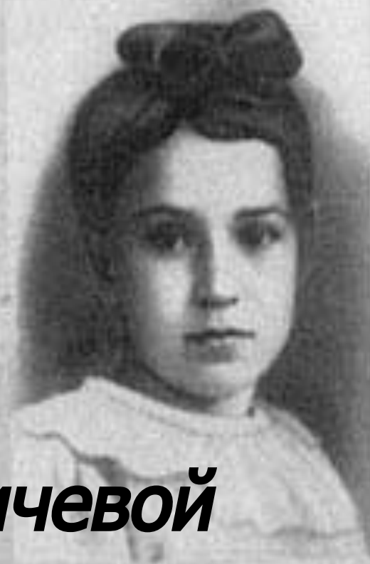
Из дневника Тани Савичевой