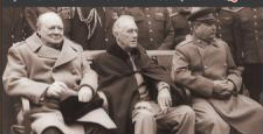
У. Черчилль (Великобритания) Ф.Д. Рузвельт (США) И.В. Сталин (СССР)