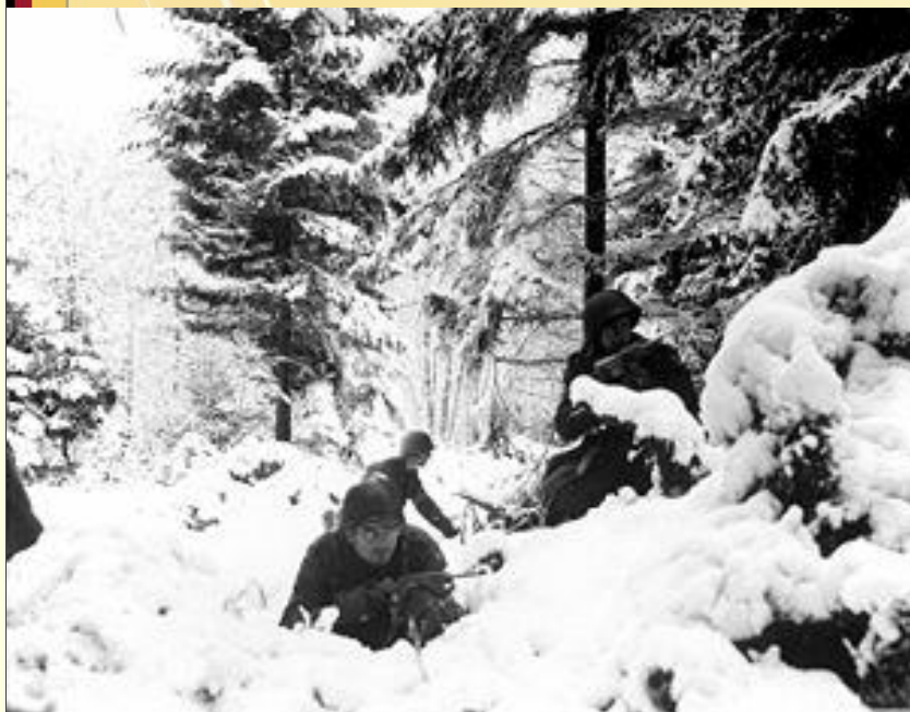
Американские солдаты 75-й пехотной дивизии в Арденнах.

Арденнская операция (декабрь 1944 - январь 1945) .Немецкие войска потеряли стратегическую инициативу после этого боя.