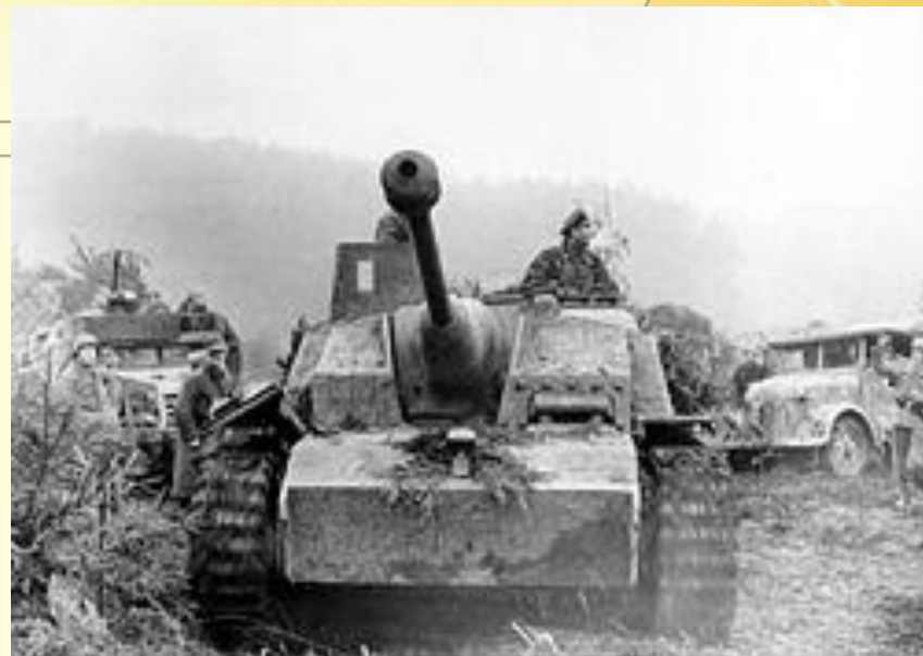
Немецкая бронетехника во время Арденнского наступления

Эльзасско-Лотарингская операция (1- 2 января 1945)