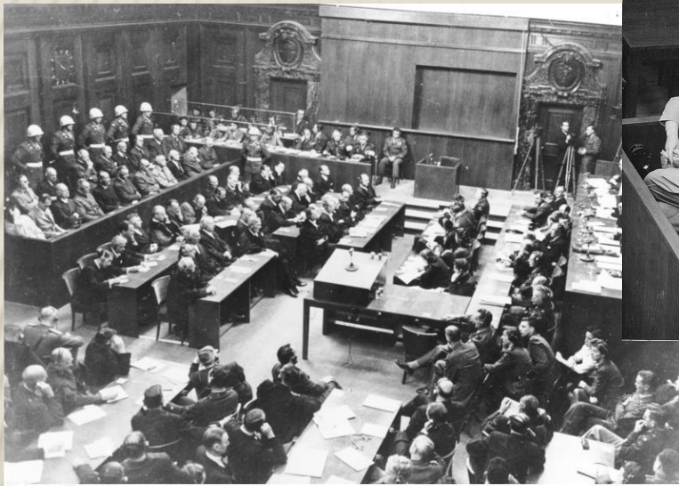
Bundesarchiv, Bild 183-H27798 Foto: o. Ang. 1.30. September 1946