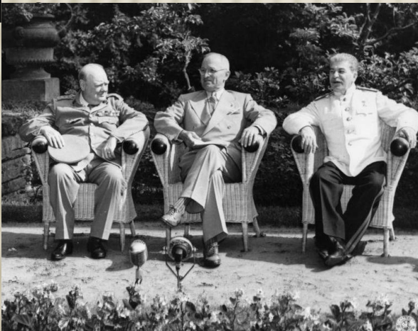
У. Черчилль, Г. Трумен, И. Сталин