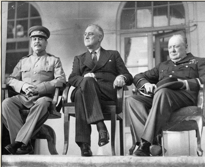
И.В. Сталин, Ф.Д. Рузвельт, У. Черчилль