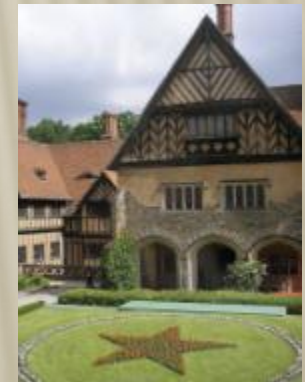
Дворец Цецилиенхоф — место проведения Потсдамской конференции