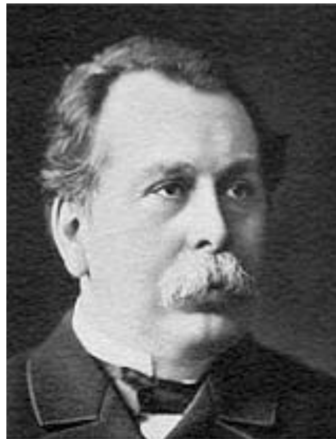
Плеве Вячеслав Константинович Министр внутренних дел с 1902 года