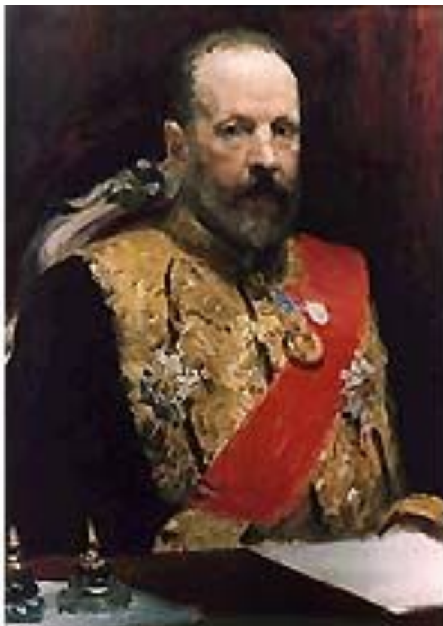
Витте Сергей Юльевич Министр финансов с 1892