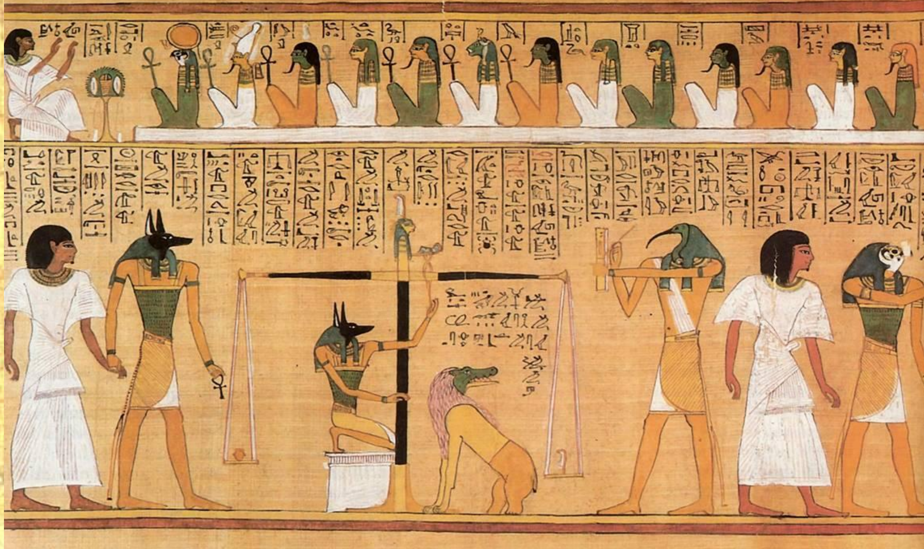
В царстве мертвых Анубис вводит душу умершего в Зал Двух Истин, где происходит суд над ней. На весах истины взвешивали сердце умершего и перышко богини правды. Если весы сохраняли равновесие, то умершего отправляли в райские поля. Если перышко перетягивало – то человека пожирало странное чудовище с головой крокодила, ногами бегемота и туловищем быка.