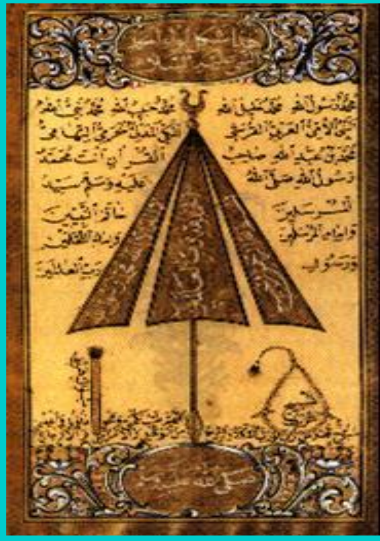
Сунна.Рукопись 8 в.

Шииты призвали народ к Свержению Омейядов. Вскоре восстали Иран и Средняя Азия.