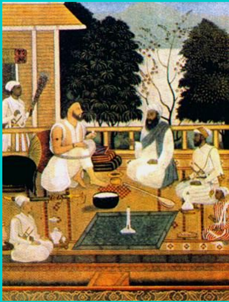
Миниатюра из «1000 и одна ночь».

Расцвет халифата пришелся на правление Халифа Харун ар-Рашида-героя «1000 и 1 ночи», где он показан мудрым и справедливым политиком.