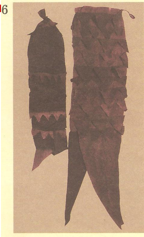
Ғұн жауынгерлері ұстаған байрақтың бір түрі