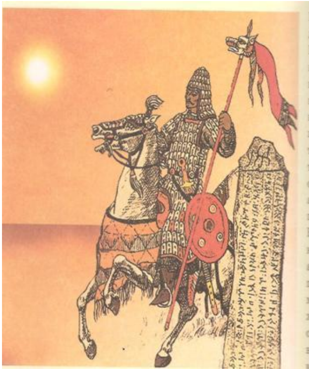
Ғұн жауынгерлері ұстаған байрақтың бір түрі