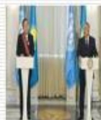
БҰҰ басшысы Пан Ги Мунмен кездесу