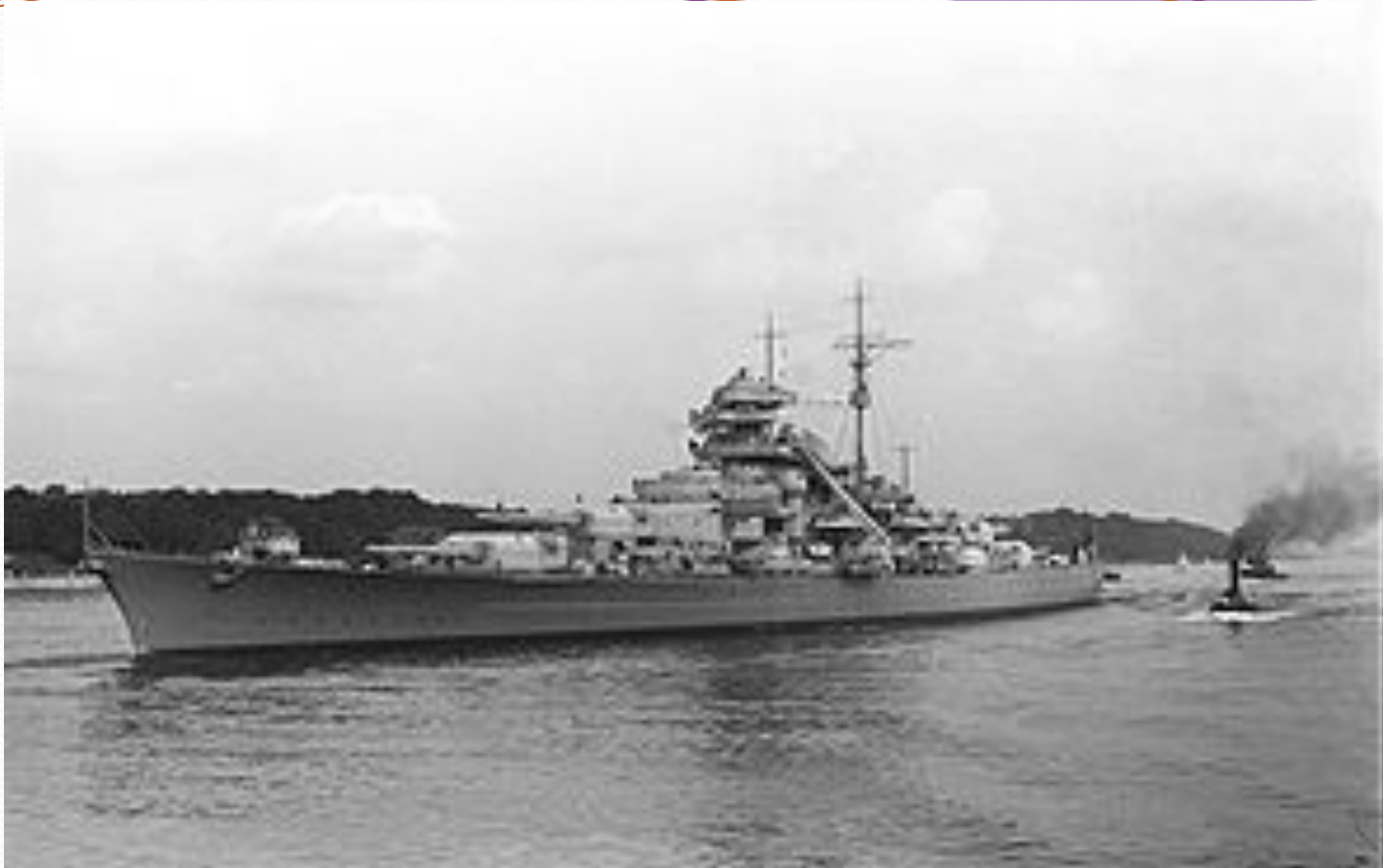
Линкор «Бисмарк», 1940 год