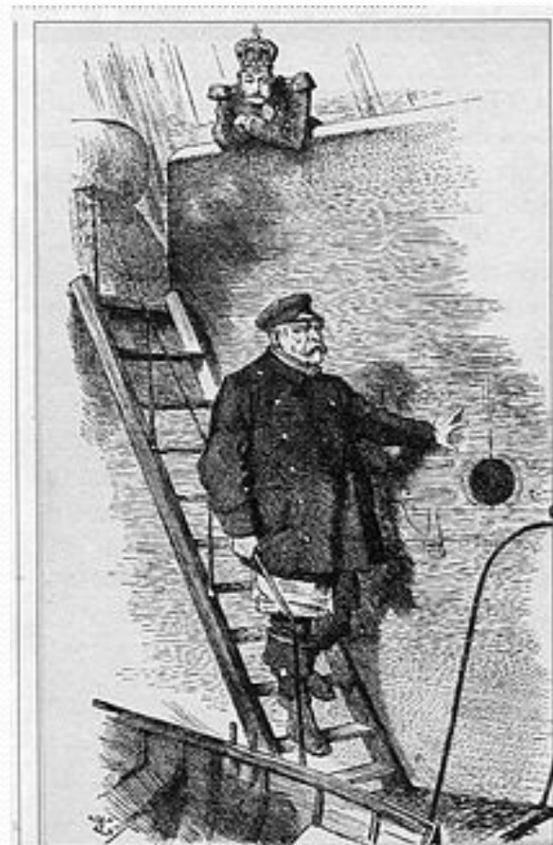
„Der Lotse verlässt das Schiff“: Mit dieser Karikatur kommentierte die britische Zeitschrift Punch 1890 die Entlassung des 75-jährigen Reichskanzlers.

13 марта 1871 года он подписал вместе с представителями России и других стран Лондонскую конвенцию, отменившую запрет России иметь военный флот в Чёрном море. В 1872 году Бисмарк с Горчаковым организовали в Берлине встречу трёх императоров — германского, австрийского и российского. Они пришли к соглашению совместно противостоять революционной опасности.