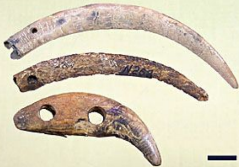
Клыки кабарги, марала, медведя

Самую многочисленную серию предметов составляют стерженьки составных рыболовных крючков. В отдельных могилах их насчитывалось более 150 штук. В процессе раскопок в погребениях были обнаружены украшения : подвески из расщепленных клыков кабана, размещавшиеся на головном уборе и на верхней одежде на груди; кальцивидные кольца; подвески из клыков марала, клыки кабарги и резцы тарбагана.