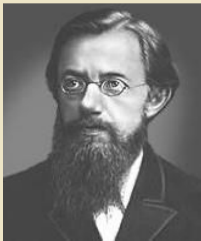
Иван Дмитриевич Черский