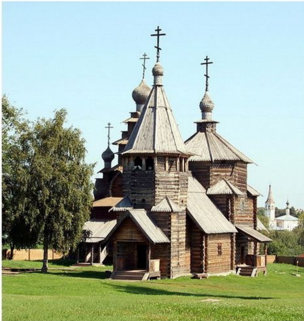
Сергей Манкелов © 2009