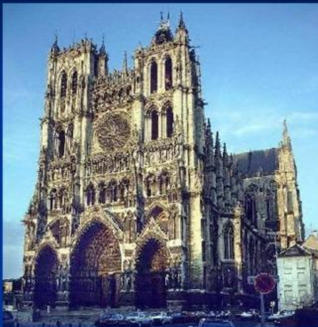
Собор Богоматери в Амьене, Франция