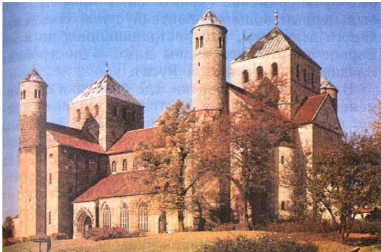
ЗАМОК СЮЛЛИ, СТРОИТЕЛИ НЕИЗВЕСТНЫ X-XI вв., ФРАНЦИЯ