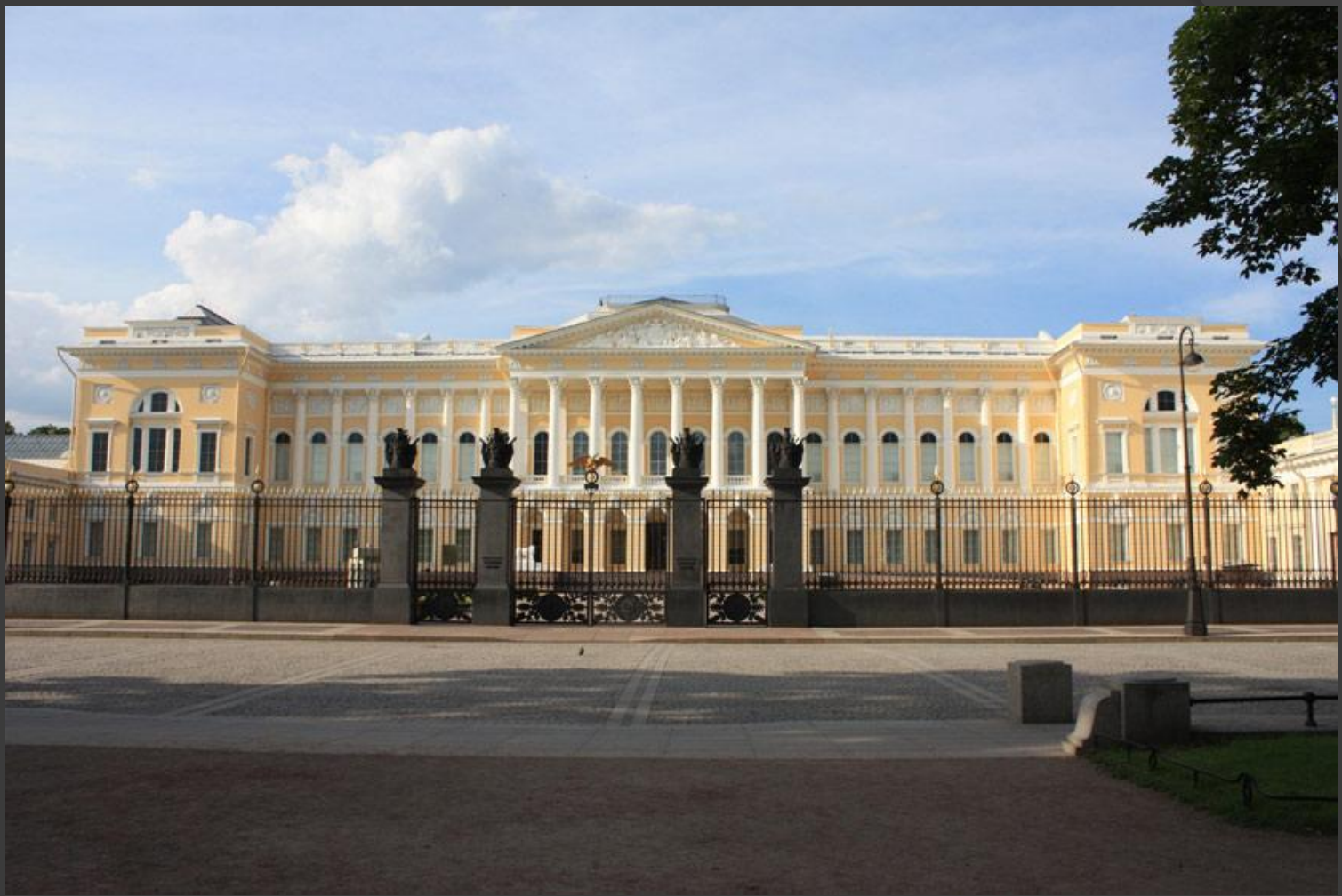
Михайловский Дворец. Санкт-Петербург. 1817-1825гг. Сейчас- Русский музей