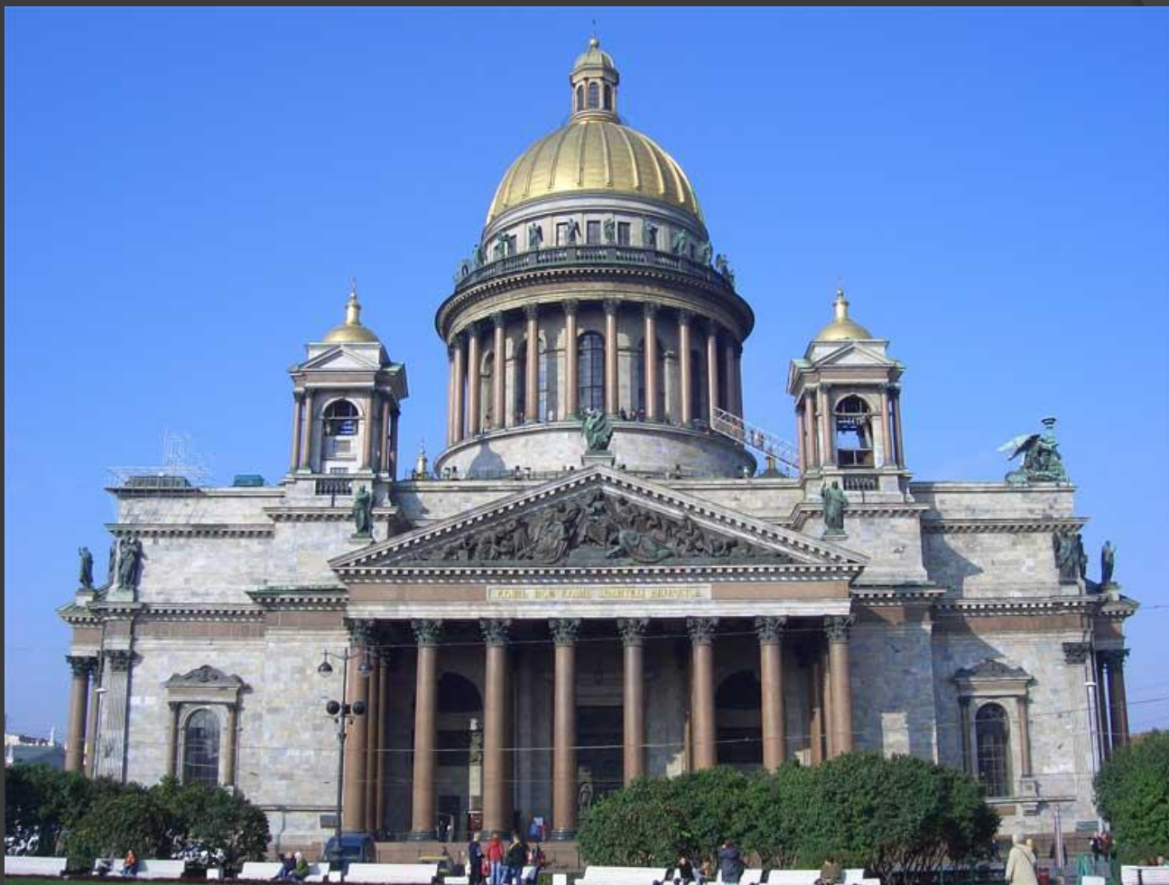
Исаакиевский собор. Санкт-Петербург. 1818-1858гг.