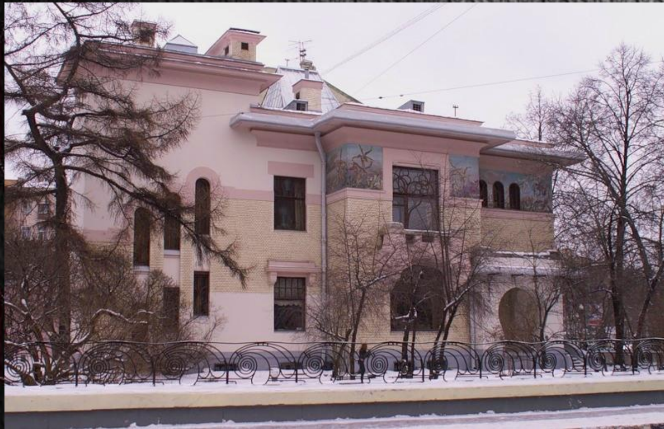
Особняк Рябушинского (1900-1902)