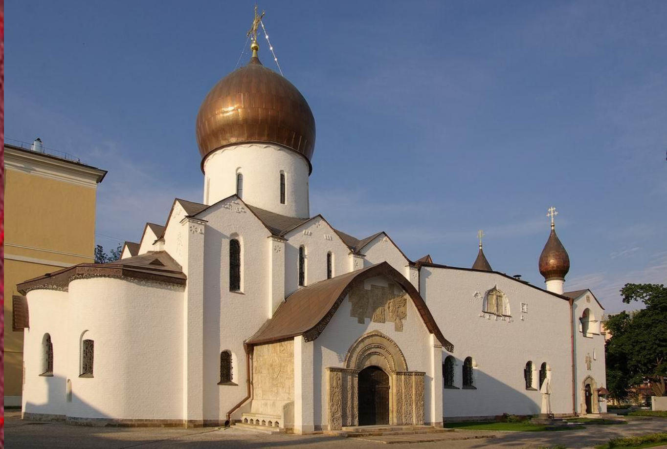
собор Марфо-Мариинской обители