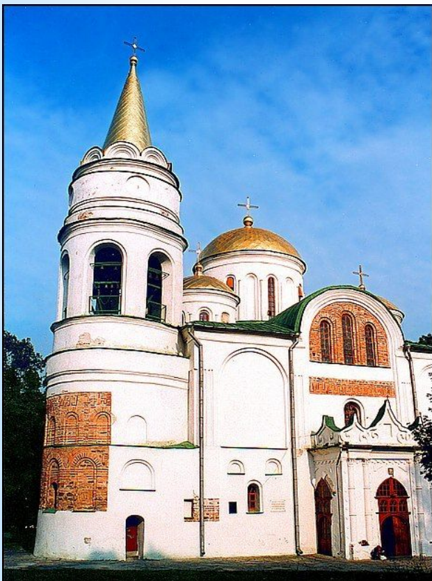
Софийский собор в Чернигове. Полоцке.