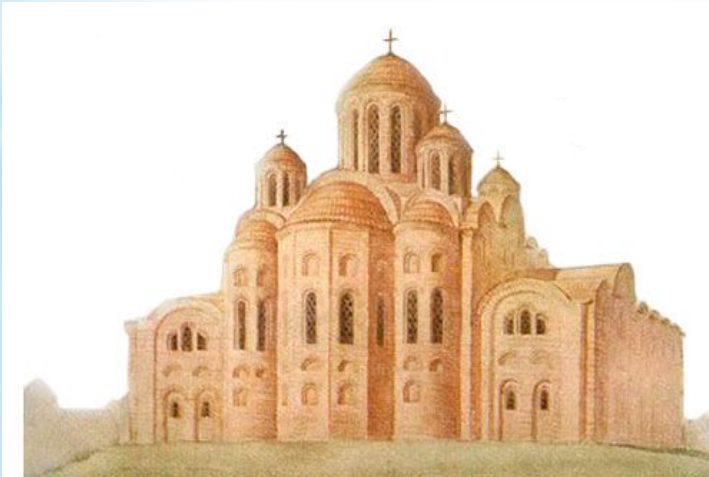
Храм Успения Богородицы (Десятинная церковь). 986–996 гг. Киев.