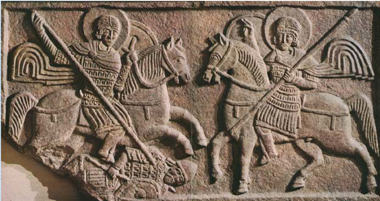
«Два всадника» фрагмент украшения Михайловског о златоверхого монастыря в Киеве