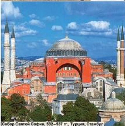
Собор Святой Софии, 532 – 537 гг., Турция, Стамбул