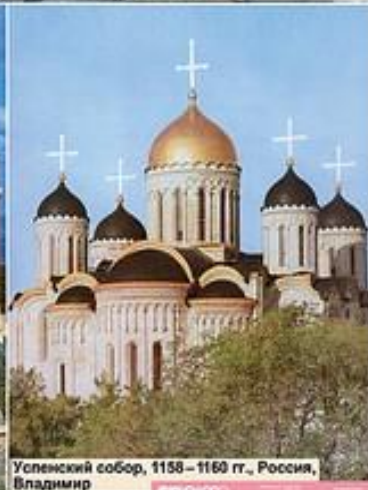
Успенский собор, 1158 – 1160 гг., Россия, Владимир