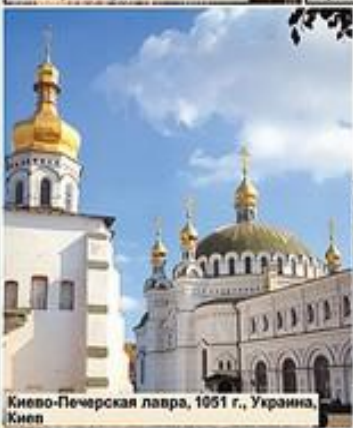
Киево-Печерская лавра, 1051 г., Украина, Киев