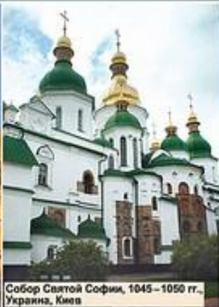
Собор Святой Софии, 1045 – 1050 гг., Украина, Киев