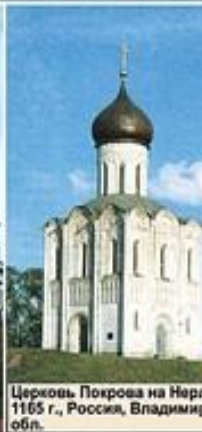
Церковь Покрова на Нерли, 1165 г., Россия, Владимир обл.