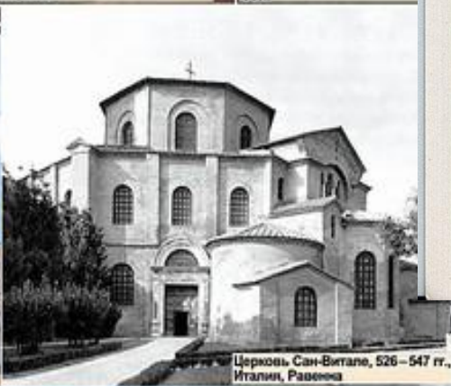
Церковь Сан-Витале, 526 – 547 гг., Италия, Равенна