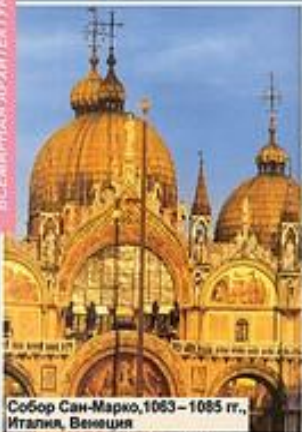
Собор Сан-Марко, 1063 – 1085 гг., Италия, Венеция