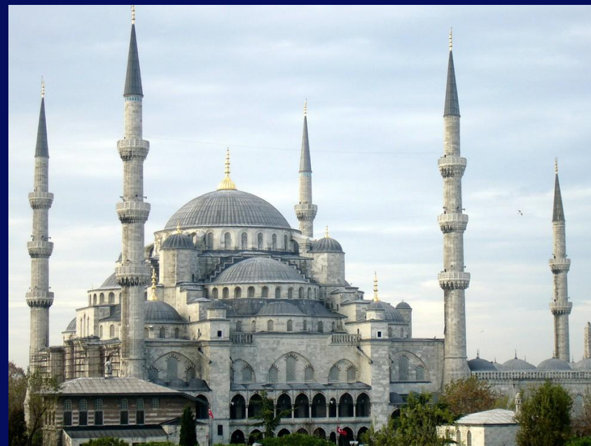
Блакитна мечеть (Стамбул)