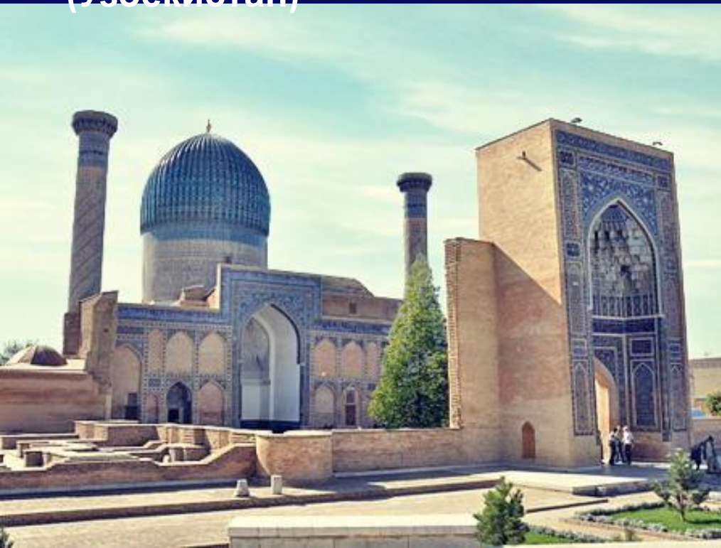
Мавзолей Гур-Емір (Узбекистан)