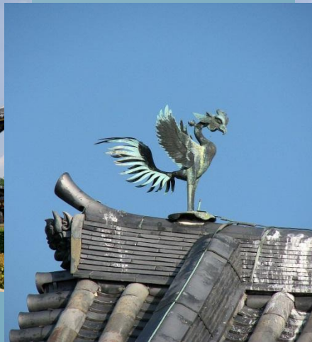
Прикраса на даху храму Хоодо