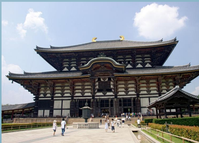
Головний зал храму Монастир Тодай

Буддизм вплинув на архітектуру синтоїстських храмів - збільшилась кількість декоративних елементів, металевих та дерев'яних прикрас.