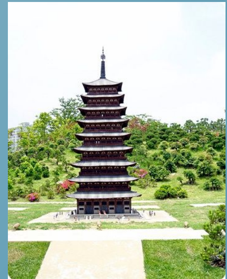
Реконструкція великої пагоди в храмі Хванненса