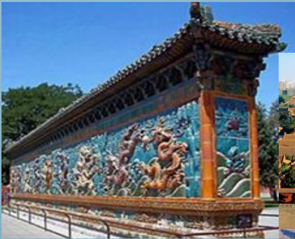
Стіна дев'яти драконів

В 14-18 ст. значно розвинулось будівництво міст, які будувалися за правилами "фен-шуй". На зміну суворості і монументальності форм прийшла легкість і витонченість. Широко застосовувався архітектурний ордер, що складається з кам'яної бази, дерев'яного стовпа, системи балок, кронштейнів ("доу-гун") і "карниза" ("Заборонене місто", "Храм неба", "Стіна дев'яти драконів" та ін.).