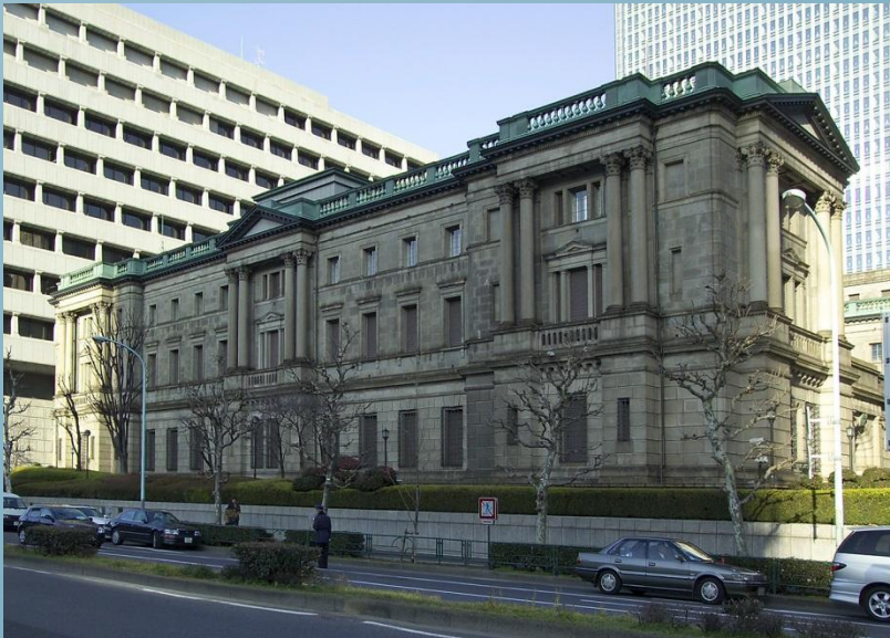
Банк в історичному стилі

Японські архітектори цього періоду запозичили як технології, так і декоративну складову європейських історичних стилів.