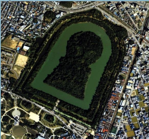
Курган імператора Нінтоку

В I-III ст. будують синтоїстські святилища, що представляють собою симетрично розташовані будівлі.