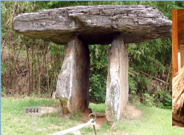
Дольмен в Кочхані

У керамічну епоху Мумун будівлі були житловими ямами зі стінами-мазанками або покрівельними дахами. Мегаліти (дольмени) використовувалися як поховальні споруди для дуже важливих і знатних людей керамічної епохи Мумун (1500-300 роки до н.е.).