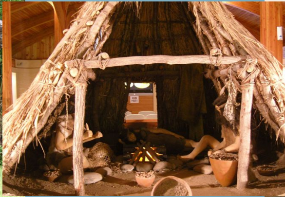
Внутрішнє оформлення житла