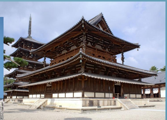
Золотий зал і пагода в Хорюдзі