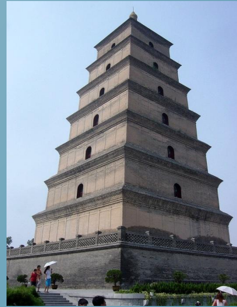
Велика пагода диких гусей