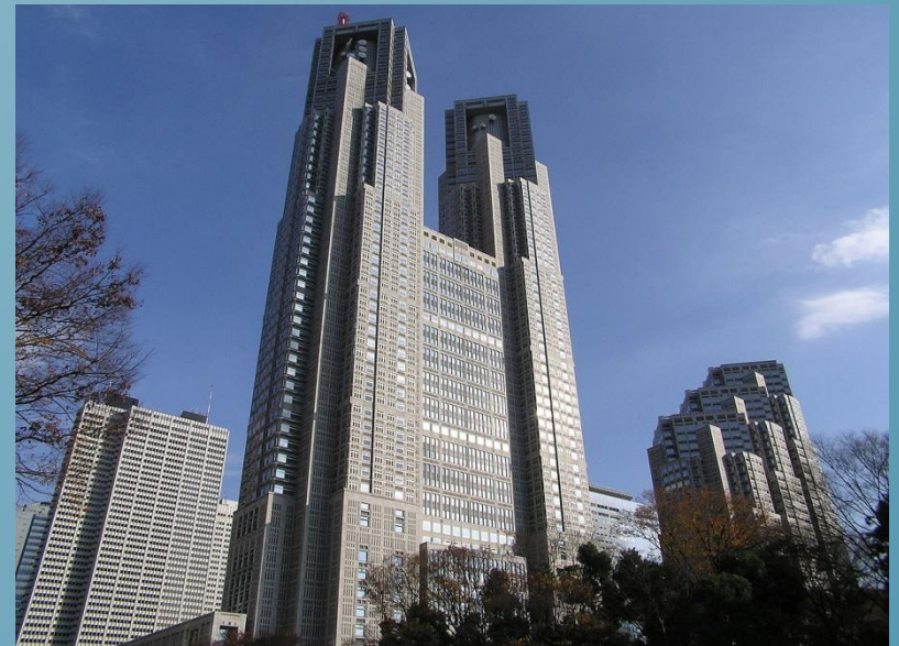
Будівля Токійського столичного уряду