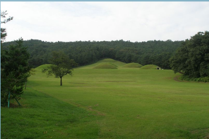
Королівський похоронний комплекс держави Пекче

Похоронна архітектура періоду трьох королівств зазвичай монументальна. Існувало два типи похоронної архітектури: перший тип - це ступінчасті кам'яні піраміди, другий - величезні земляні насипи.