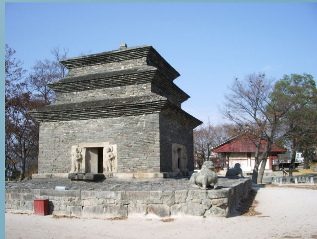
Пагода храму Пунхванса