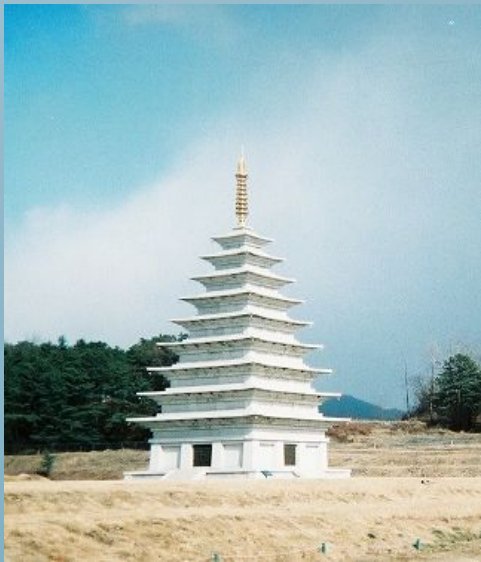
Реконструкція східної кам'яної пагоди

Будівництво храмів буддистів було сприйнято з ентузіазмом після поширення буддизму в 372 році з Північного Китаю. На ділянках, де за часів трьох ранніх корейських держав перебували будівлі, під час розкопок виявляють візерункові плитки та кам'яні пагоди, що свідчать про високорозвинену культуру Кореї.