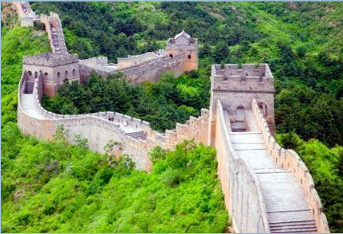
Велика китайська стіна

У 4-3 ст. до н.е. для захисту від нападів кочовиків споруджується Велика китайська стіна.