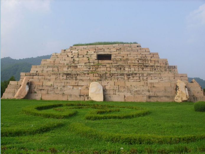
Могила великого короля і воєначальника Когурьо