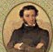
Александр Сергеевич Пушкин 1799 - 1837