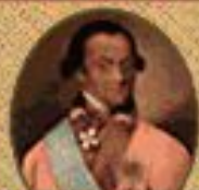
Абрам Петрович Ганнибал 1696 - 1781