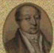
Василий Львович Пушкин 1766 - 1830