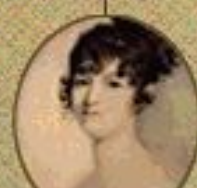
Надежда Осиповна Ганнибал 1775 - 1836