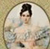
Наталья Николаевна Гончарова 1812 - 1863