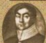
Петр Абрамович Ганнибал 1742 - 1825