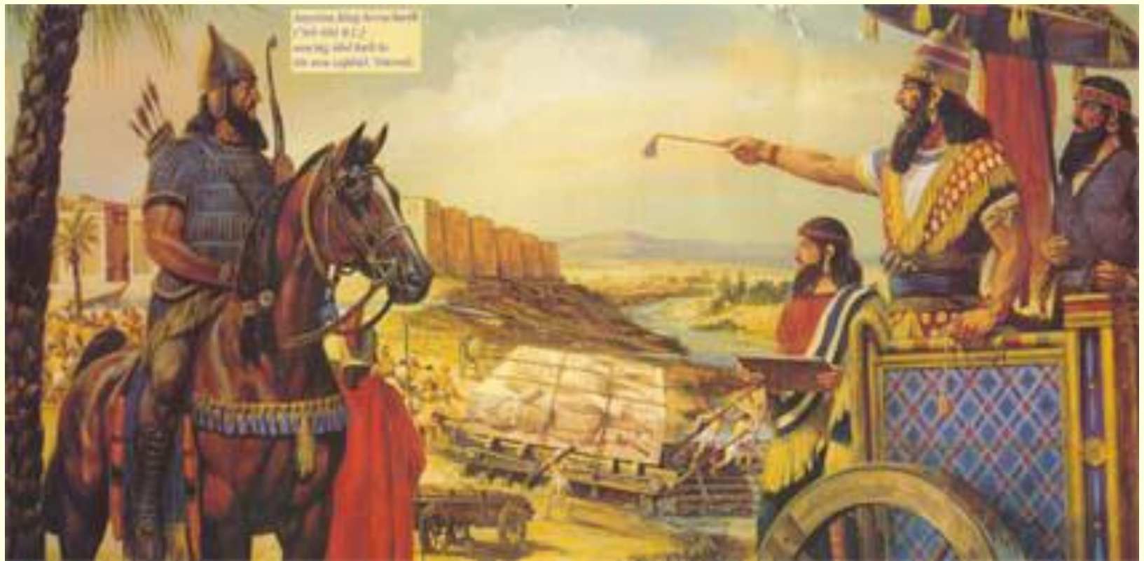
Amnon, King Achish's son, Came and sat across the wall to the new capital, Hebron.